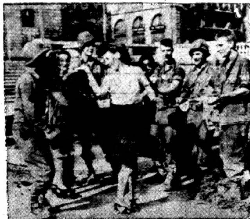
Rennes miesto, kurį Amerikos kariuomenė išlaisvino iš nacių, viena prancūzaitė gatvėje šoka su amerikiečiu kariu.