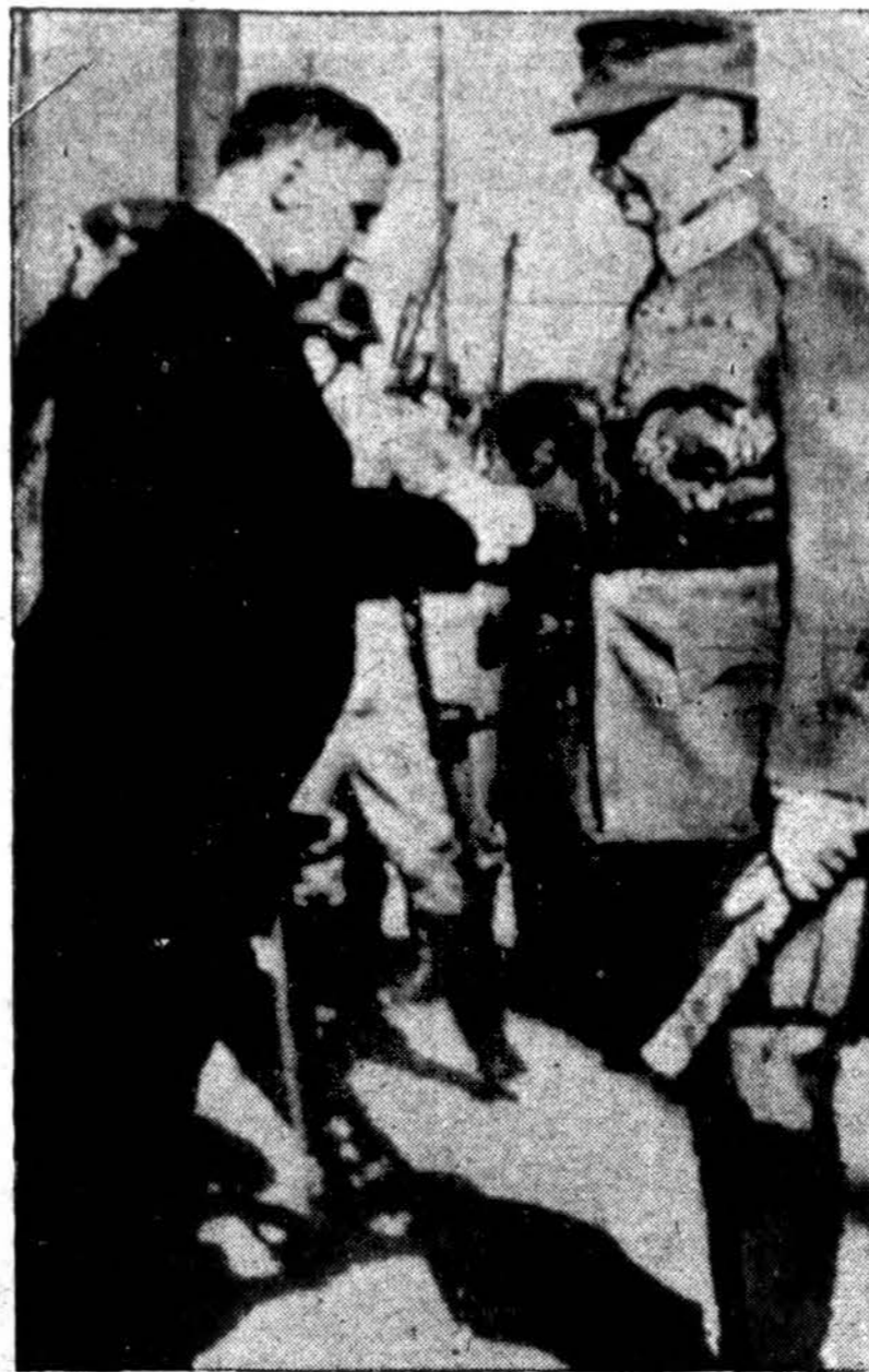
Field maršalas Carl Mannerheim (dešinėje), naujas Suomijos prezidentas, sveikinasis su Edwin Linkomies, ministrų pirmininku, po priesaikos iškilmių.