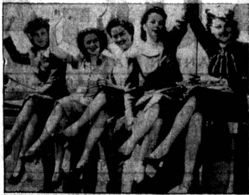
Pirmosios australietės, Amerikos kareivių žmonos, atvykusios į Ameriką. Nuotrauka padaryta joms išlipus iš laivo San Francisco uoste.

Pusrūsyje telpa salė, kepykla, vaikams dušai, sargo butas ir centralinio šildymo įrenginiai. Pirmame aukšte dvi erdvios klasės, klozetai ir mokyklos vedėjo butas. Pastogėje — antro mokytojų butas. Bokšte telpa vandens 10 kub. metrų kubilas. Langai, durys, stiklai, grindys, centrinio šildymo įrengimai bei visi sanitariniai prietaisai atvežti iš Amerikos. Taip pat iš Amerikos atvežti mokiniamis suolai bei rašomosios lentos.