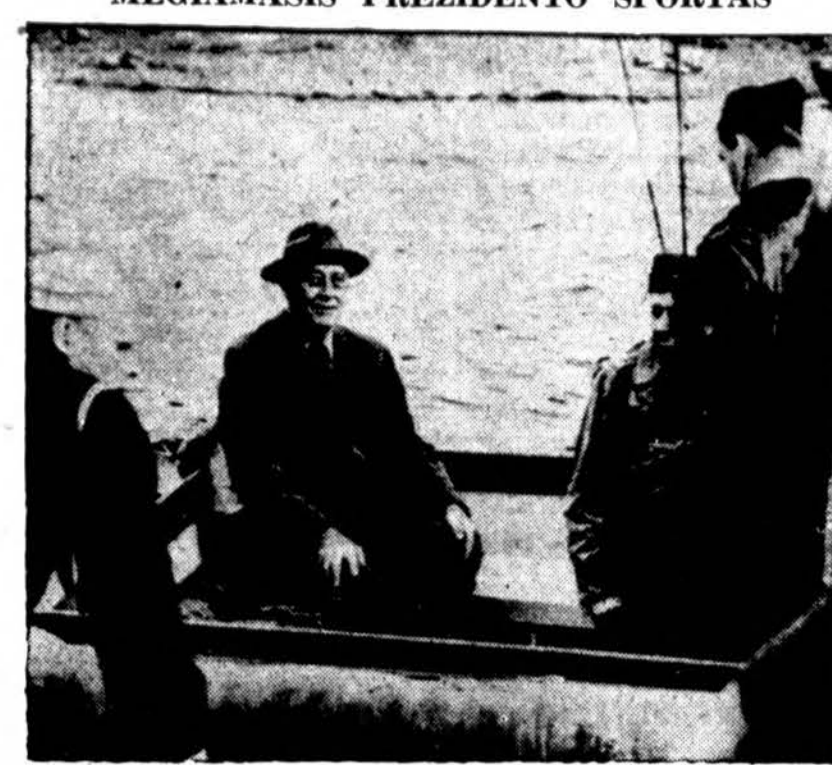
Pastaroje savo kelionėje Pacifike prezidentas Rooseveltas gavo progos ir pažuvauti prie Kodiak salos, Alaskoj. Sako, žygis nebuvo veltui — prezidentas pagavo dvi didelės žuvis.

kaip dabar iš paveikslo jis žiūri savo mėlynomis akimis į šiuos užklydusius pašalaičius, taip prieš šimtą metų jis gal ilgias valandas pro langą stebėjo aplinkinius kalnus, grožėjosi jų spalvomis, mąstė apie Dievo veikalų galybę, apgalvojo žmonių vargus, išmoko juos pažinti, suprasti ir vėliau, jau iš popiežiaus sosto, surikiuoti į naujesnes, teisingesnes gaires, kurių pasaulis tačiau nenorėjo priimti, pamėgęs savo purvą, skriaudą ir neteisybę, nuėjęs paskui grubius ir bukus vadus.