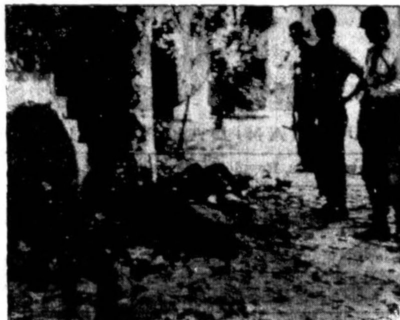
Amerikos kareiviai vienam Prancūzijos miestelyje žiūri į kritusius vokiečius, kurie bandė priešintis pas arajai sąjungininkų invazijai į pietinę Prancūziją.