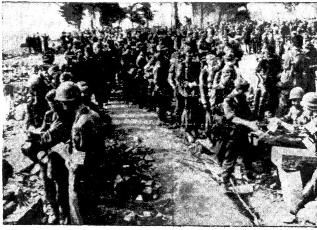
Pulkai vokiečių belaisvių, kurie buvo suimti pietinėje Prancūzijoje, suskaitomi netoli St. Tropez amerikiečių militarinės policijos narių.