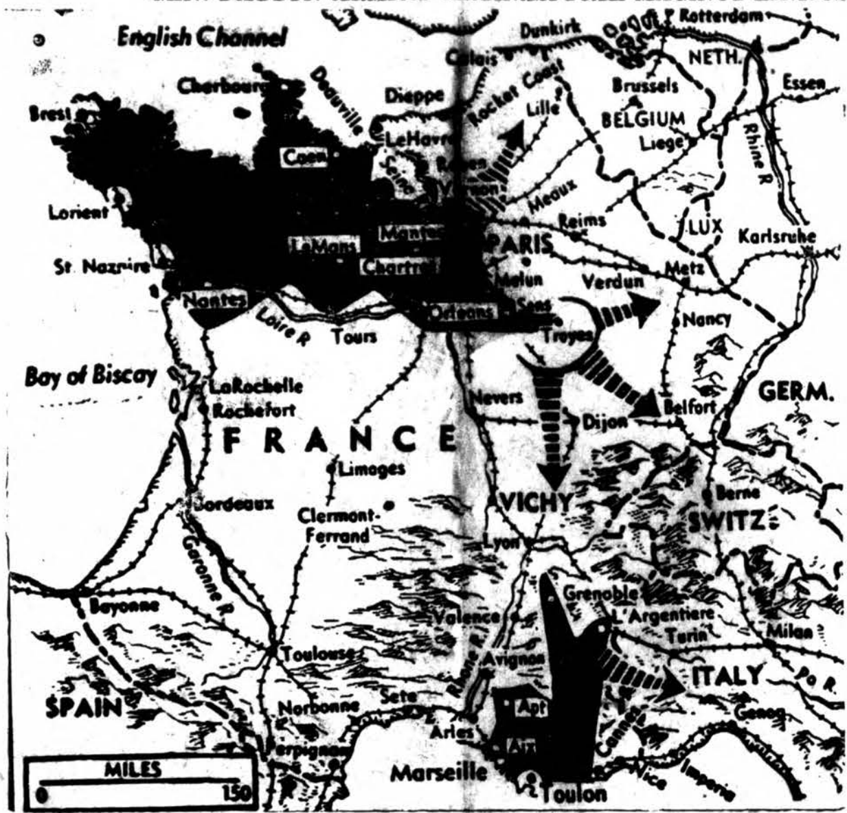
Gen. Patton trečioji armija, skubėdama į Troyes, bus pozicijoj varytis į Metz, Maginot linijos tvirtovę; Belfort perėja, netoli Vokietijos, ir susijungti su septintąja armija, kuri žygiuoja iš Grenoble ir, sakoma, uždariusi perėjas tarp Prancūzijos ir Italijos Alpių kalnuose šveicarijos pasieny. Pietuose, sąjungininkai puola Toulon iš jūros, oro ir žemės.