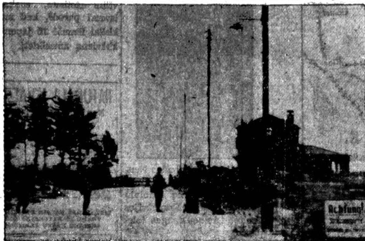
Keletą sekundų po šio vaizdo nutraukimo, nacių snaiperiai, pasislėpę apgriuvusiamename, dešinėje, ėmė į šiuos aliantų kareivius šaudyti. Du kareiviai krito nuo kulku, o fotografinkas ir kiti kariai sukrito duobėse iki kol prisiūsta pagalba priešą iškraptė. Tai įvyko kur nors Prancūzijoje.