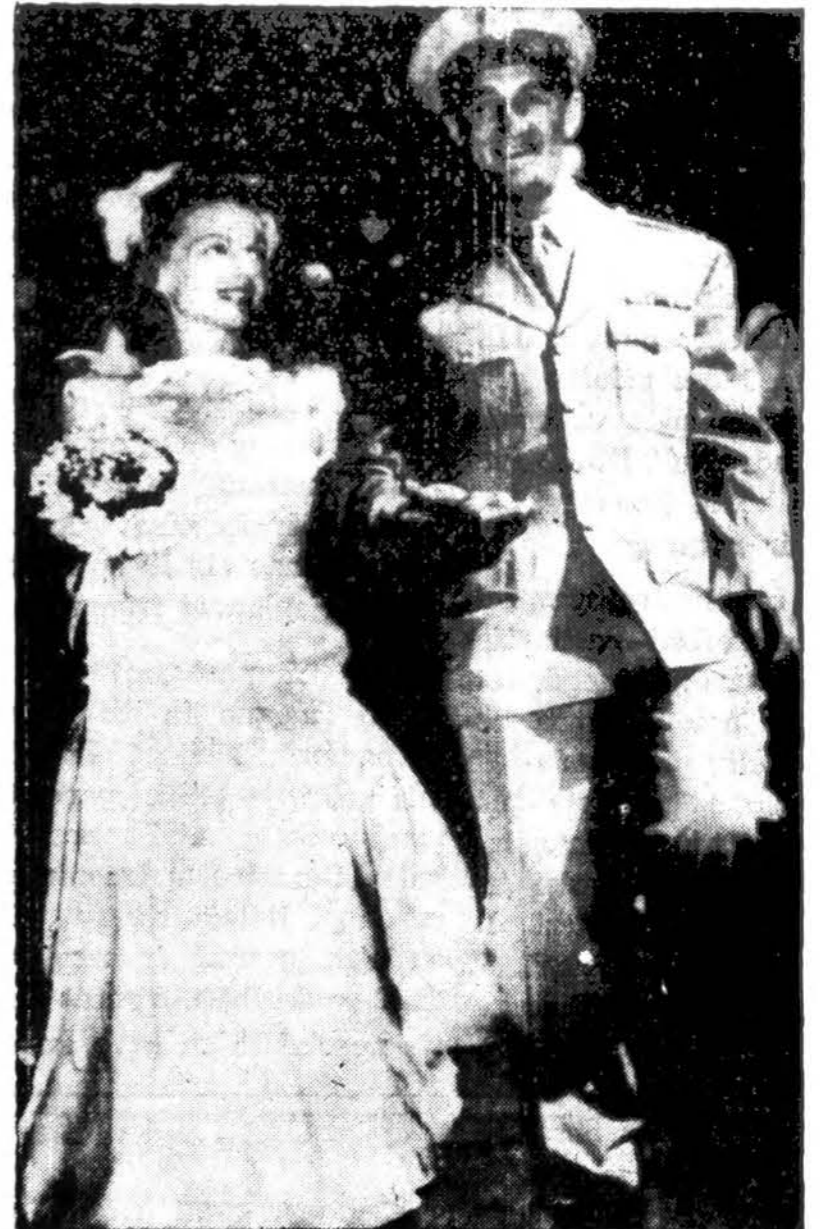
Leitenantas T. Harmon susituokęs su artiste Elyse Knox išeina iš bažnyčios Ann Harbor, Mich. Jaunoji dėvi suknelę, pasiūtą iš parasuto, kuris išgelbėjo Harmono gyvybę.