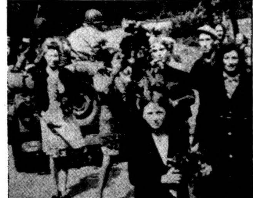
Forge Philippe kaimelio, Belgijoje, gyventojai džiaugsmingai pasitinka Amerikos kariuomenę. Gėlių buketai ir merginų bučkiai svajdomi ir pravažiuojančius džipais (jeep) kareivius.