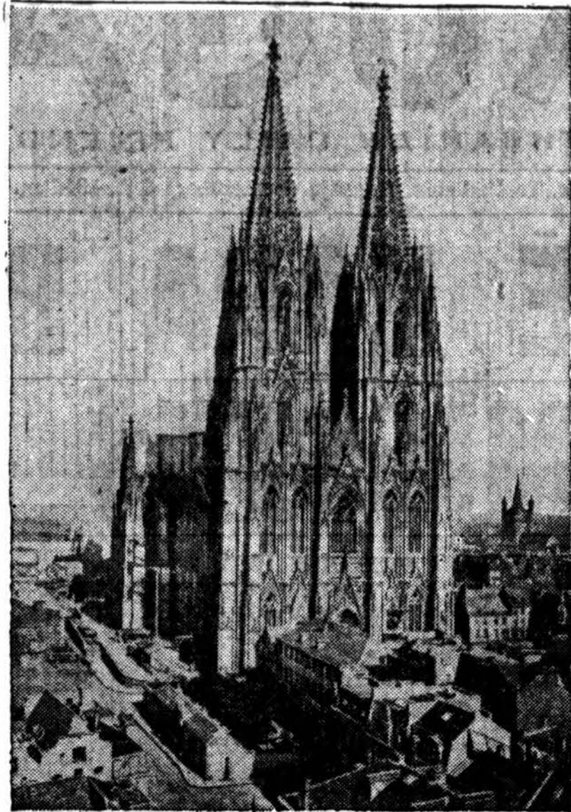
Cologne katedra yra viena gražiausių katalikų bažnyčių Vokietijoje. Ji yra pakeliui amerikiečių žygiavimo pirmyn — į Vokietiją. Viso pasaulio katalikams rūpi, kad ši gražioji bažnyčia nenukentėtų.

kone apskrities miestas. Tarp gėlynu ir žaliu pievėliū, aukšta mūro tvora apverti stovėjo keli apvalūs ir vienas ilgokas keturkampis kaliniu namai. Kitoj pu-