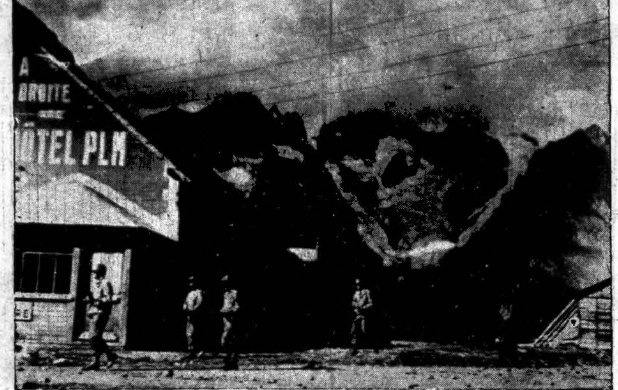
Amerikiečių patrulė grįžta į savo linijas po susirėmimo su naciais prie Briancon, Prancūzijoje. Užpakaly matosi sniegu padengtos Alpės viršūnės. Sąjungininkai pietinėje Prancūzijoje skuba į Belfort perėją, per kurią galės veržtis į Pietinę Vokietiją.