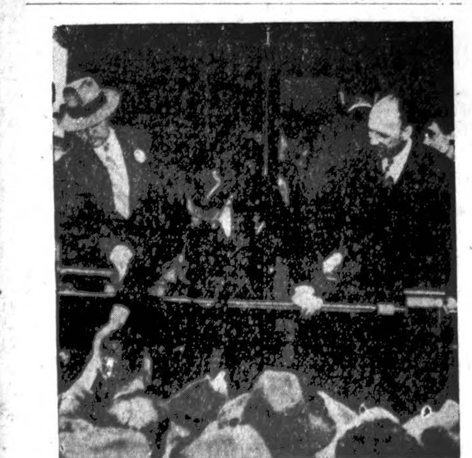
Thomas E. Dewey, respublikonų kandidatas į prezidentus, sveikinamas Dėsa Moines, Iowa, gyventojų jam atvykus sakyti agitacinę kalbą.