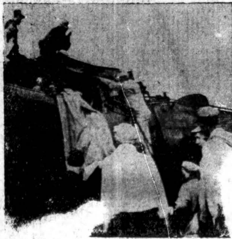
Valstybės ir miestelių policija, geležinkelių darbininkai ir civiliai iš visos apylinkės subėgę į dviejų traukinių katastrofos vietą ir iš sudaužytų vagonų rankioja žuvusius keleivius. Katastrofa, kaip jau žinome, įvyko netoli Terre Haute, Ind.