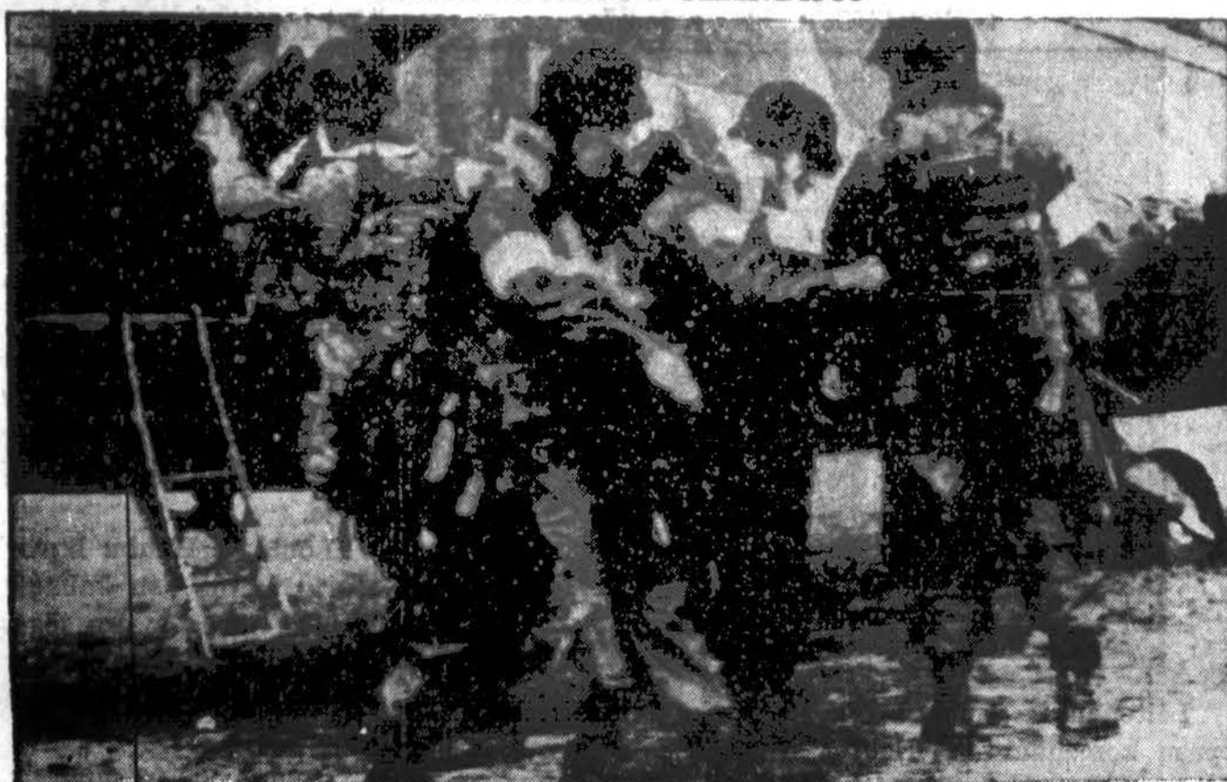
Užgrūdinti Amerikos kariai — parašutinkai lipa į karo lėktuvus, kurie juos išmes vokiečių užnugaryje Olandijoje. Daugiau kaip tūkstantis lėktuvų ir sklandytuvų (gliders) buvo panaudota tai invazijai.

Šįmet Lietuvos Vyčių organizacijos seimas įvyks