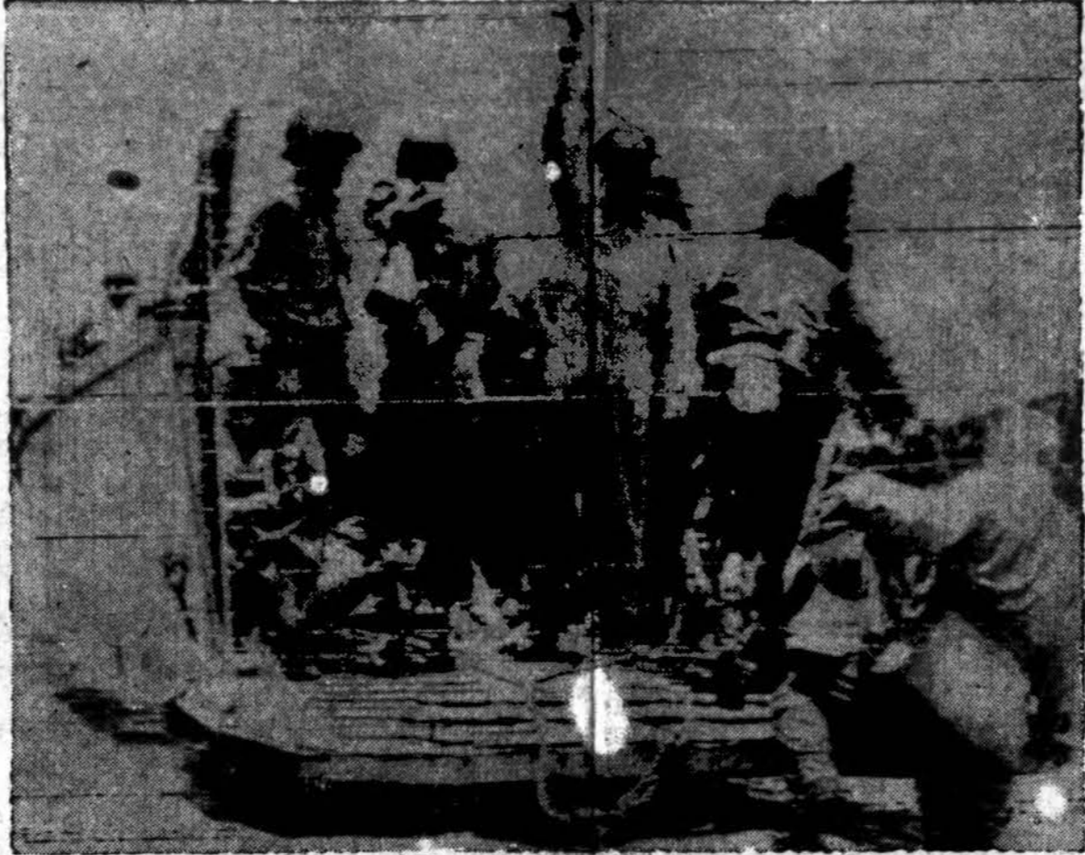
Gen. MacArthur stovi išlaipinimo laive, atsisveikindamas su kariais, kurie įvykdė sėkmingą invaziją Morotai saloje, Halmahera salyne. Amerikiečiai inžinieriai tuoj ištaisė užimtą aerodromą ir žvalgybos lėktuvai jau vartoja jį.