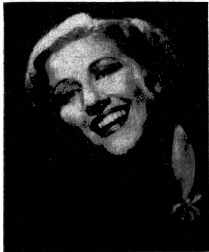
POLYNA STOSKIUTES, Operos žvaigždės