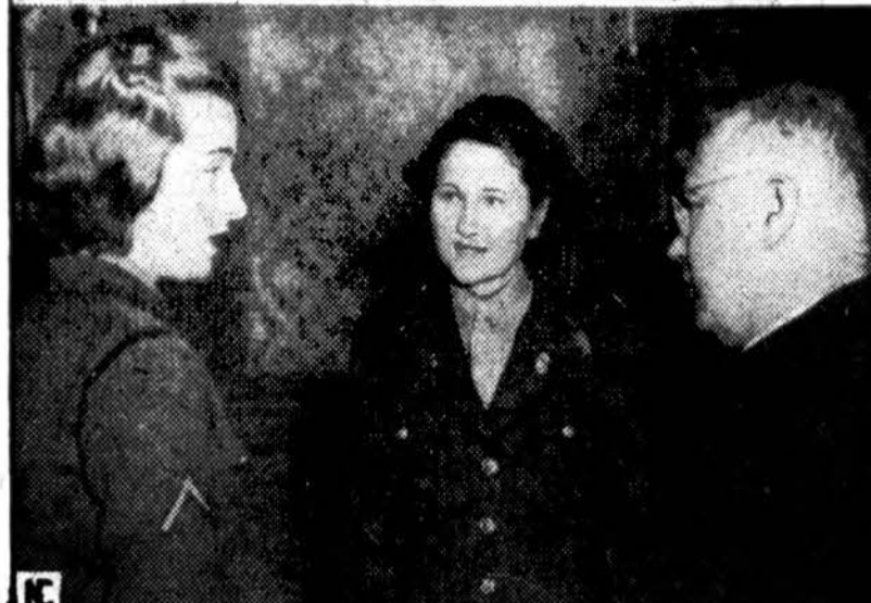
Arkiyvuskapas Francis J. Spellman, iš New Yorko, U. S. ginkluotų jėgų kariškas vikaras (viršutinis paveikslas) kalbasi su Paryžiaus kardinolu Suhard. Žemutiniame paveiksle matome arkiyvuskapą Spellman kalbant su WACs, lankant ginkluotas jėgas.