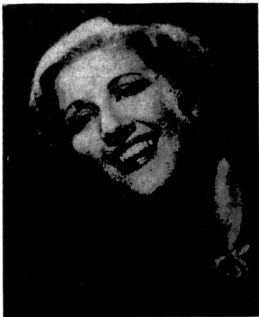
POLYNA STOSKIUTĖS, Operos Žvaigždės