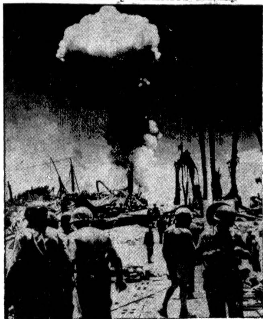
Numetęs bombas ant japonų aliejaus tanko prie Boela, Ceram saloje, A-20 Havoc lėktuvas skrenda atgal į savo bazę.