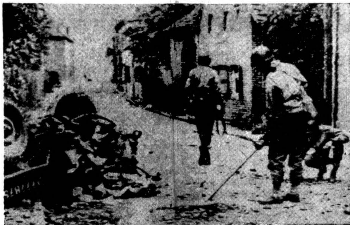
Vienam Vokietijos kaimė gatvėje sprogo mina, kuri sudraskė jeep'ą ir užmušė tris amerikiečius. Amerikiečiai apklausinėja vokiečius civilius ir apžiūri gatvę, kurioje gali būti daugiau minų.