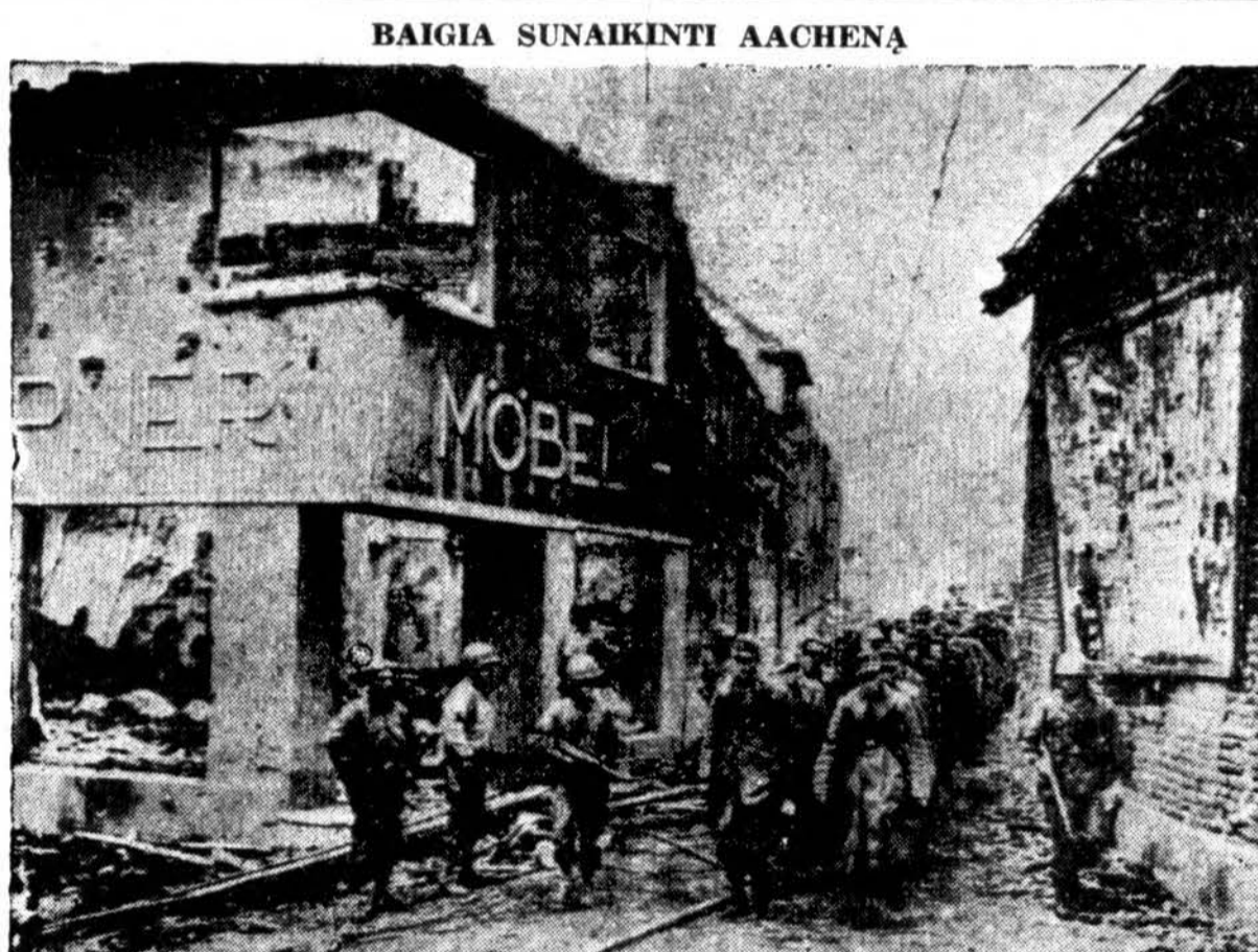
Senasis Aachen miestas, geriau žinomas senuoju prancūzišku vardu Aix-la-Chapelle, sunaikinamas amerikiečių artilerijos ir bombų. Vokiečiai atsakė jį atiduoti. Atvaizdo centre matosi istoriškas Rathaus, kuris buvo pastatytas 1353 metais.

Nacių DNB agentūra beveik tuo pat metu perdavė japonų komunikato turinį. Formosa sala randasi apie 100 mylių nuo Kinijos krantų ir apie 550 mylių žemiau Japonijos pietinių salų. Sujungus šį pranešimą su ankstyvesnėmis žiniomis apie atakas ant Ryukyu salos, atrodo, kad Amerikos jėgos nori suminkštinti japonų pozicijas arčiau Kinijos krantų. Iki šiol nebuvo sąjungininkų patvirtinimo šiam raportui apie ataką, bet manoma lėktuvnešių dalinys galėjęs pradėti tokią ataką.