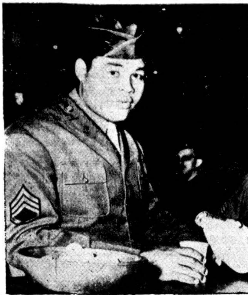
Staff Sgt. Joe Louis, pasaulinis kumštinių žaidimų čempionas, geria pienu New York aerodrome po lėktuvu kelionės iš Europos, kur buvo suruošęs keletą kumštinių žaidimų pramogai.

Uždaryk langą nuo saulės, o atidarysi duris daktarui. Žmonių priežodis