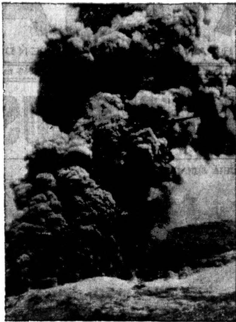
Užimdami Angaur salą, už šešių mėnesių nuo Peleliu salyno, amerikiečiai išsprogdino japonų amunicijos sandėlį. Vienas Amerikos karių gesina gaisrą, kad neišsiplestų po salą.

suomet darbuojasi parapijos parengimuose ir yra pirmieji paremti visus reikalus ir sumanymus. Klebonas labai džiaugiasi turėdami tokius gerus pagelbininkus.