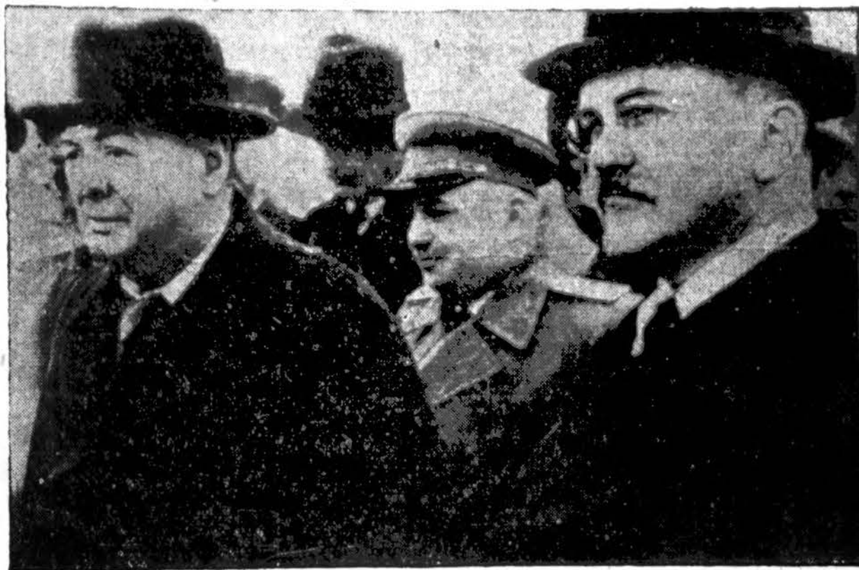
Britų ministrų pirm. W. Churchill nufotografuotas jam išlipus iš lėktuvo Maskvos aerodrome. Su juo britų užsienių reikalų ministras Eden, bolševikų vice komisaras I. M. Maisky ir komisaras V. Molotov.