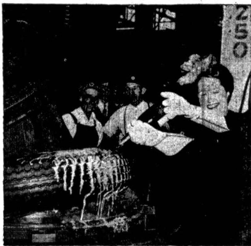
SAMPANAS PIRMAI PADANGAI