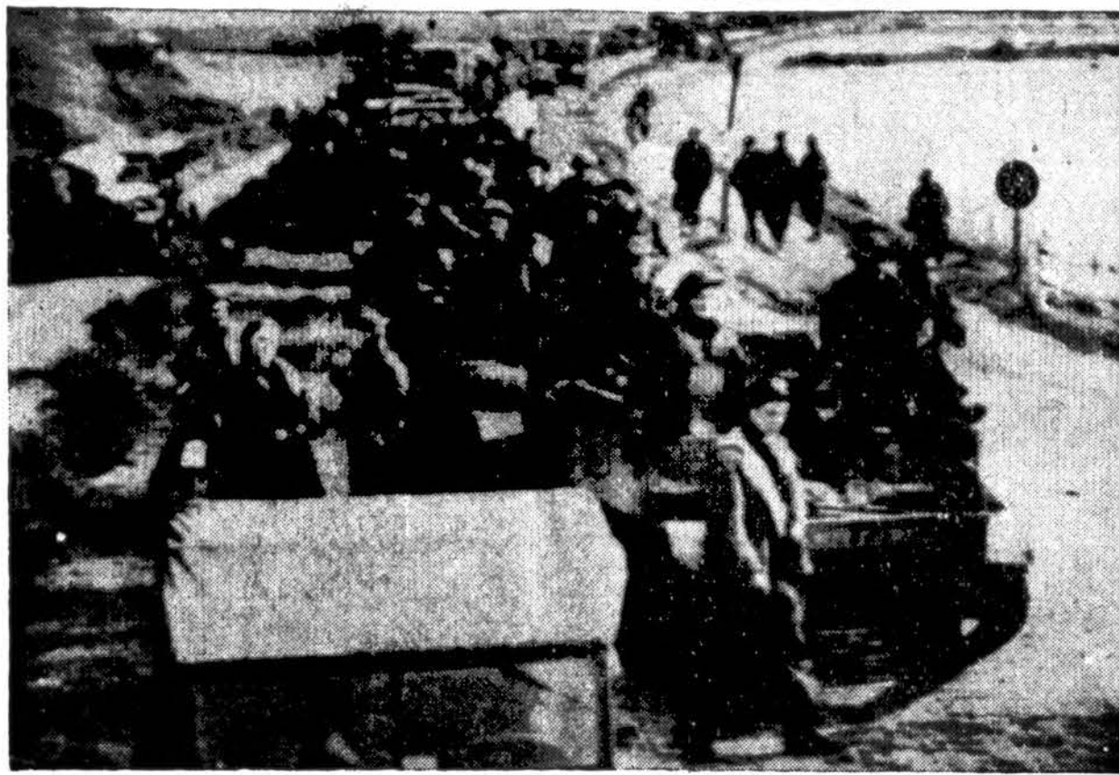
Ilgą eilę sąjungininkų vežimų laukia pervažiuoti per kalną užlietą pietinė Beveland. Kanadiečiai užėmė didelę Tholen salą, į šiaurę nuo Beveland-Walcheren salų, kuri nebuvo nacių ginama.