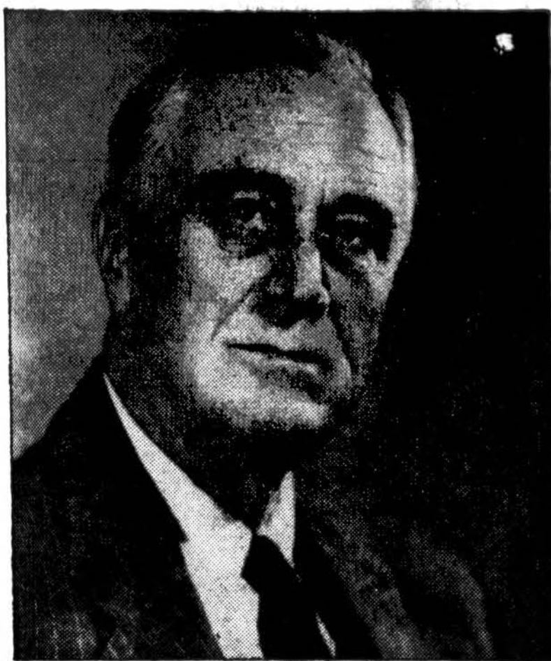
Prezidentas FRANKLIN D. ROOSEVELT