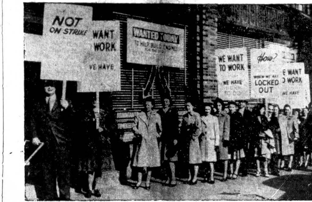
Maždaug 32,000 darbininkų šiandien grįžo darban penkiuose Wright Aeronautical Corp. fabrikuose Paterson, N. J. apylinkėje. Tiek žmonių neteko darbo, kuomet 1,800 užvaizdų išėjo ant streiko. Cia matoma, kaip raštinės lange reikalaujama darbininkų, o nedirbą asmenys nešė plakatus, kuriais reikalavo darbo.