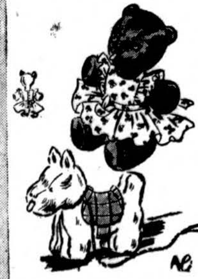
Stuffed toy dog and teddy bear. Patterns also for dog's blanket, bear's overalls and pinafore. Simplicity Pattern 1149, 15¢