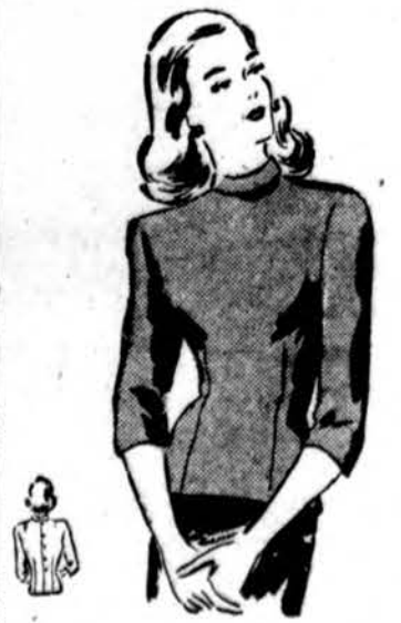
Back-buttoning overblouse "as good as gold." Sizes 12 to 20. Size 16, 1 3/4 yds. of 41" fabric. Simplicity Pattern 1155, 25¢