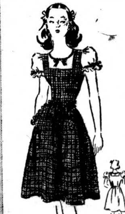
Jumper and blouse in sizes 12 to 20. Size 16 blouse, 1 3/4 yds. 35"; jumper, 3 yds. of 35". Simplicity Pattern 1130, 15¢