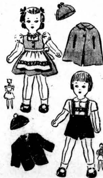
Patterns for girl and boy rag dolls and their clothes. Girl's dress is like that in photograph at left. Simplicity Pattern No. 1143, 15¢

2334 So. Oakley Ave. Chicago 8, Illinois