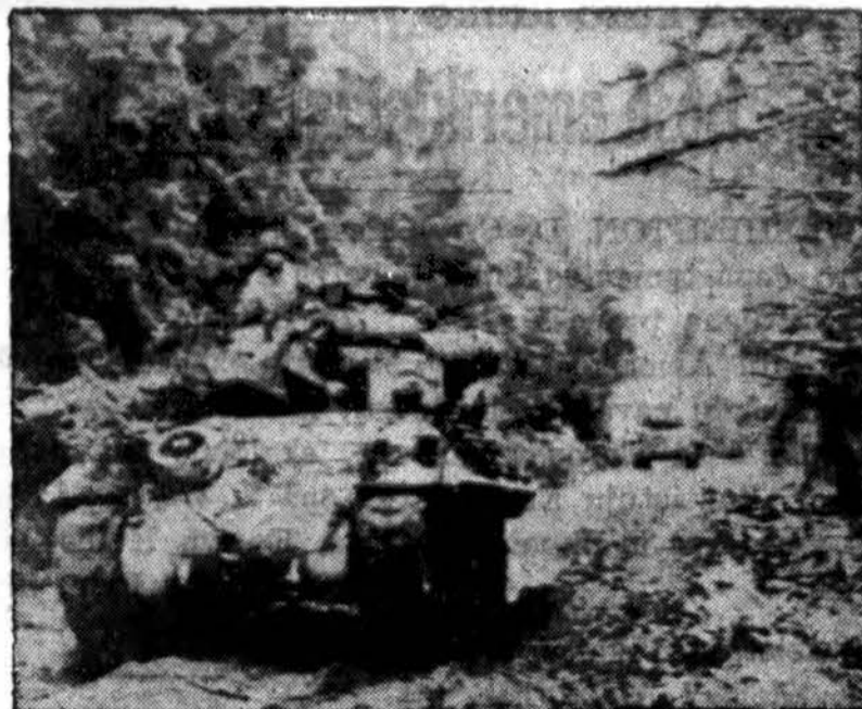
Amerikos tankai-naikintuvai skinasi kelią per Hurtgen miškus linkui Schmidt, Vokietijoje, kur naciai buvo įstiprinę.