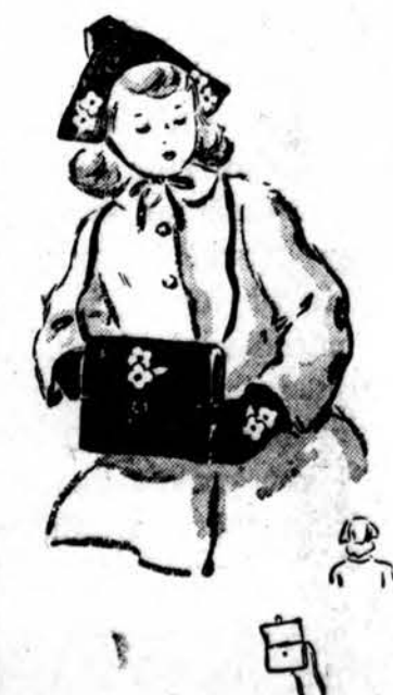
Dutch cap, muff bag, and mittens for little girls. Velvet with felt applique makes gay set. Simplicity Pattern 1142, 15¢