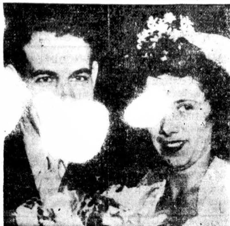
Pulkininkas Elliot Roosevelt, vienas sūnų prezidento Roosevelto, susituokęs su Faye Emerson, Warner Bros. kino artiste.