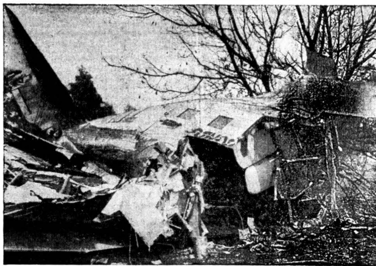
Atvaizde matoma kas beliko iš TWA keleivinio lėktuvo, kuris krito į žemę besiuošdamas nusileisti Van Nuys, Cal., aerodrome. Iš 23 keleivių ir įgulos, septyni žuvo ir 16 buvo sužeisti.