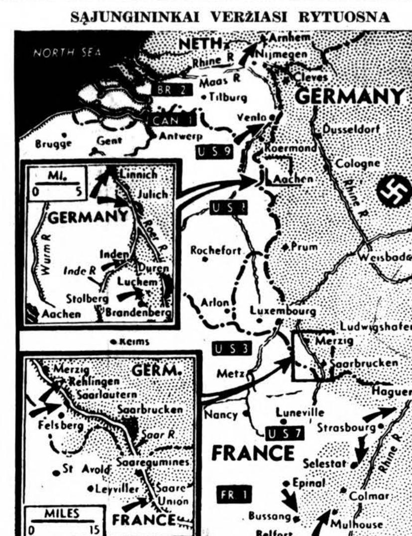
Amerikos 3-ios armijos kariai veržiasi pirmyn anapus Saar upės į Saar klonio centrą, pakeliami užimami Saarlautern ir Saare Union. Pirmoji ir devintoji armijos įsilaužė į Linnich ir Julich ir užėmė Luchem, keturias mylias nuo Dureno. Septintoji armija užėmė Selestat ir įsiveržė į Haguenau, o prancūzai užėmė Bussang.

Gruodžio 6 d.: Šv. Nikolajus; senovės: Tolutis ir Visgirė. Gruodžio 7 d.: Šv. Ambrazas; senovės: Ringis ir Vėtra. ORAS Nebus didelės atmainos.