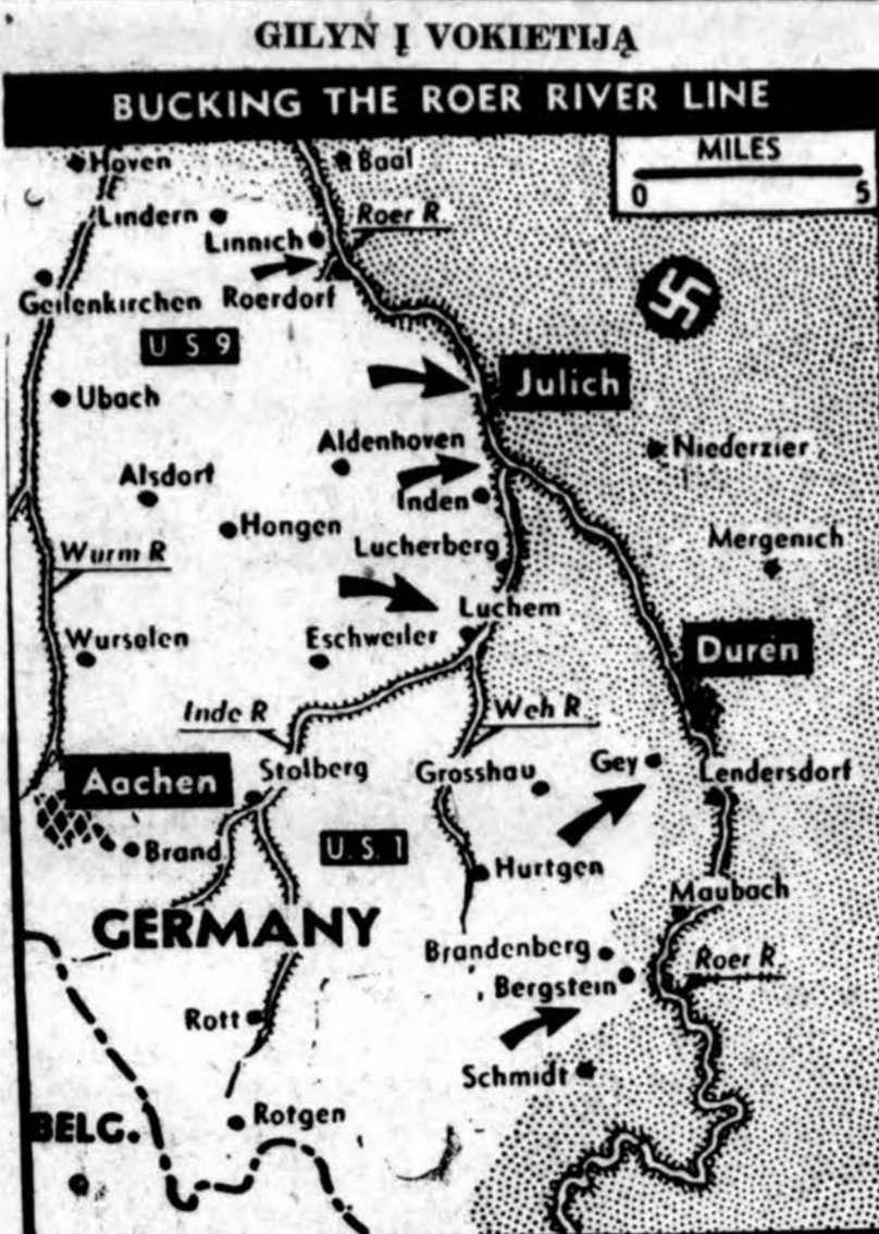
Naujas žemėlapis vakarų fronto, kur Amerikos Penktoji Armija užėmė Bergstein, tik pusė mylios nuo Roer upės. Julich ir Linnich rajonuose Amerikos Devintoji Armija taip pat sėkmingai ardo vokiečių Sigfried liniją.

Pirkite pas tuos biznerius, kurie skelbiai "Drauge."