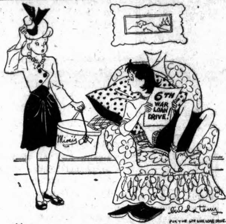
"I'm buying MY winter outfit at the Post Office this year—to wear in 1955."

Pasaulio Sodalicijos Dienos radijo programoj, kurią leido sodaliečių centras iš St. Louis, Missouri, buvo perskaitytas laiškas prezidento Roosevelto. Jis užgėrė sodaliečių darbuotę ir baigdamas parašė: "Šiuose laikuose aš žinau, kad tos motinos, kurios yra Sodalicijos narės, suranda stiprybę ir viltį iš savo ypatingo pamaldumo prie Marijos, ir taipgi randa ramybę žinodamos, kad jų sūnūs su savo gyvybe kovoja už teisybę ir pasigailėjimą; už tas pačias teises, kurias Marijos Sūnus paaukojo savo gyvybę Kalvarijoje."