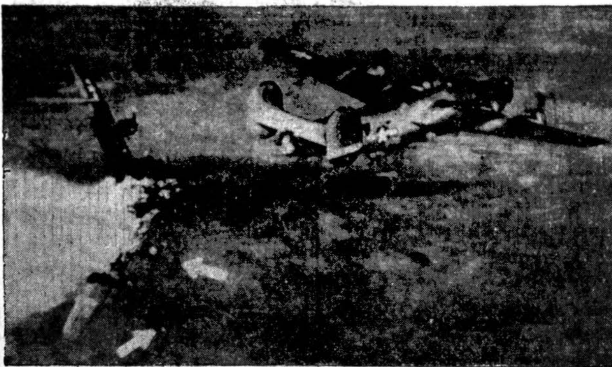
Bombos krenta iš 15-tos komandos Liberator lėktuvo, kuris buvo užgautas priešlėktuvinių patrankų ugnies, apvirto ir krito žemyn. Tas įvykis virš Blechhammer, Vokietijos. Nepažeista apie lėktuvo įgulos narių likimą.