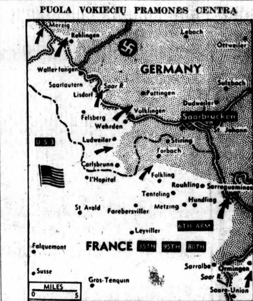
Trečios JAV armijos daliniai randasi apie tris mylias nuo Saarbrucken, ir jau įėjo į Forbach miestą, paskutinį didesni nacių laikomą miestą pietvakariuose. Penktos amerikiečių divizijos dalyvauja Saarbrucken ofensyvoje.

Pietiniam fronto gale prancūzų 1-oji armija pasistūmė į šiaurę arčiau Colmar, ir iki 32 mylių nuo Amerikos 7-tos armijos.