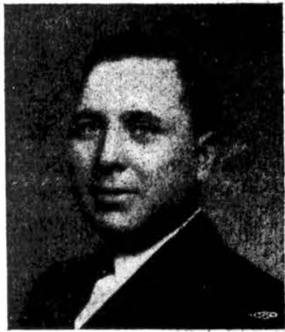
RICHARD J. DALEY