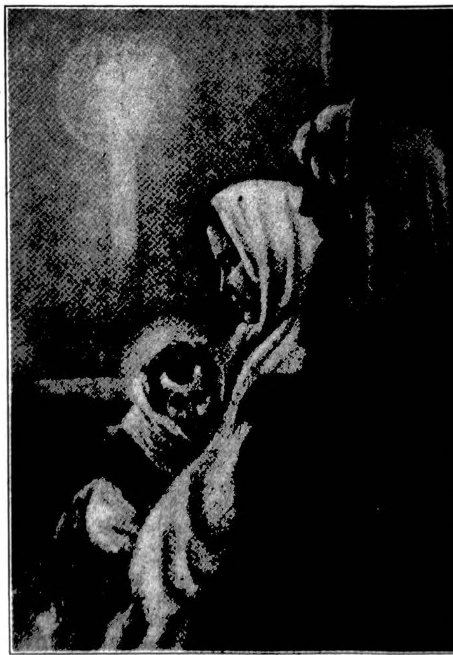
Sveikas Jėzau gimusi, — šventas Dievo Kūdikis!

—Taip aš atsimenu, pratarė jaunikaitis, buvo tai Kalėdų vilija, lygiai tokia jau naktis kaip šita, kada tas atsitiko. Ištiesų tokia netikėseną pradžią gintų kiekvieną, tik ne biedną asmenį, o vienok aš laimiuo, kad aiškiau girdėti muziką, staiga piano balsas nutrūko, tarytum paskutinė skundo styga panaši į verksmą.