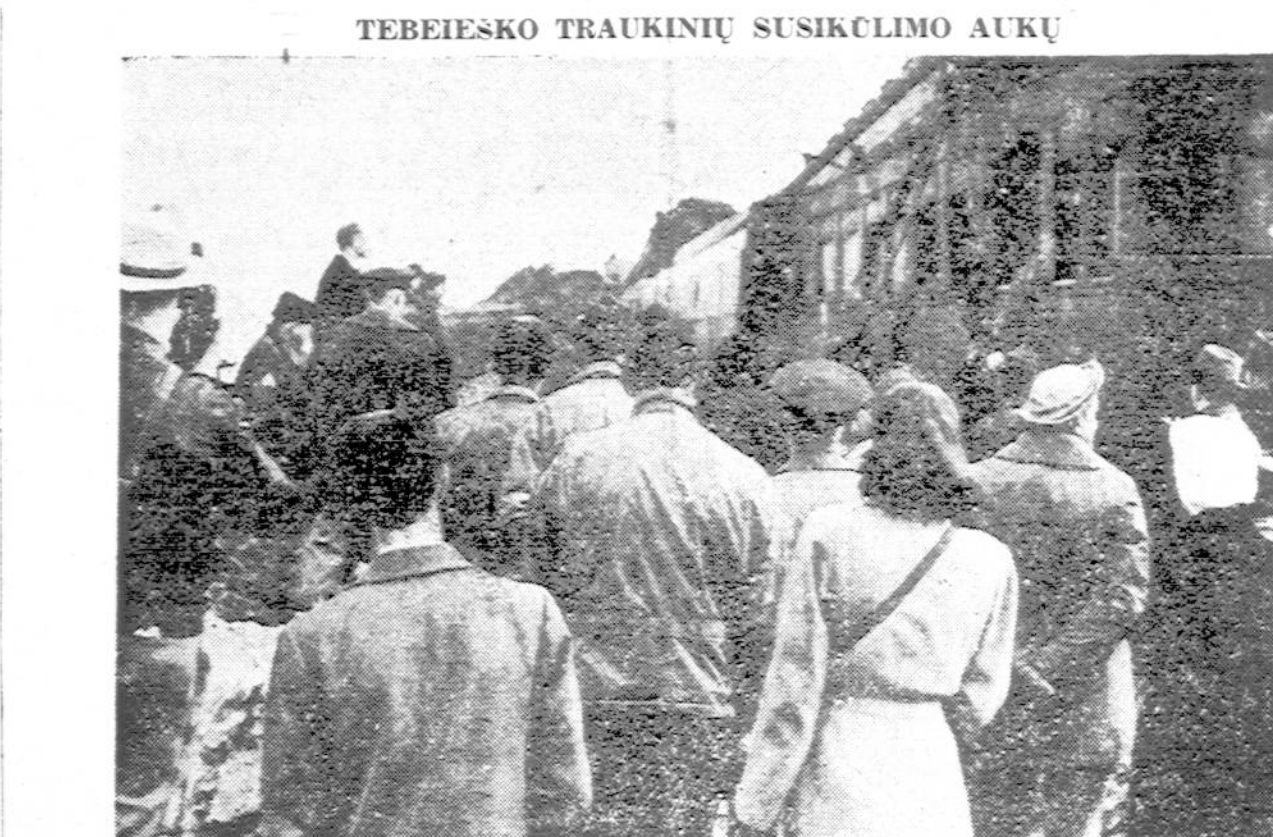
TEBEIESKO TRAUKINIŲ SUSIKLIMO AUKU Darbininkai dirba, kad išimti vieną iš 50 lavonų iš sudužusių Southern Pacific traukinių, kurie susikūlė netoli Great Salt ežero, į vakarus nuo Ogden, Utah, Naujų Metų išvakarėse. Geležinkelių žmonės sakė tai buvo baisiausia traukinių nelaimė vakarinėse valstybėse.

to, Min. Pirm. Churchillio ir Marš. Stalino suėjimas. Lenkijos liaudininkų partija, kuriai vadovauja Stanislaw Mikolajczyk, vis dar kritikuoja teisėtos vyriausybės nusistatymą, bet drauge su Arciszewski vyriausybe smerkia Liublino komitetą kaip Maskvos padarą. Jeigu Maskva manė, jog Liublino komiteto žygius ras pritarimo Londone, ji nusivylė, kadangi tam žygiui pritaria vien tik šimtaprocentiniai komunistai.