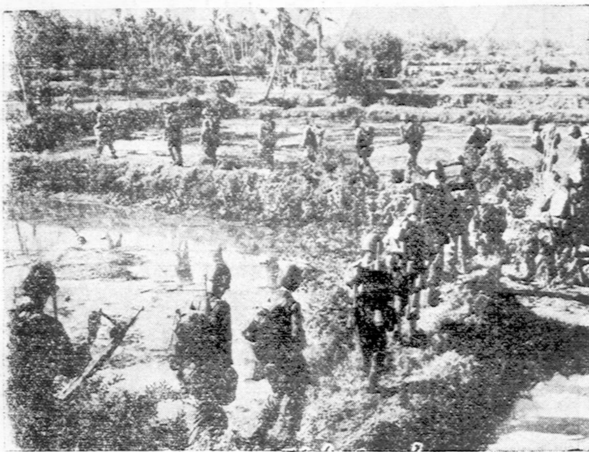
Amerikos kariai Luzon saloje, per ryžių laukus, eina pirmyn besitraukiančių japonų pedomis. Iki šiol amerikiečių invazija į šią salą nesutiko didelio japonų pasipriešinimo.

metais, rodėsi, buvo išnykusios. Bet įdomiausia tai antilopė — kardas (Hippotragus niger), juoda, ilgais ragais ir plačiu kaklu, aukštai iškelta galva. Reikia pažymėti, kad beveik visi parko gyventojai labai jaukūs, kas palengvina jų išaiškinimą.