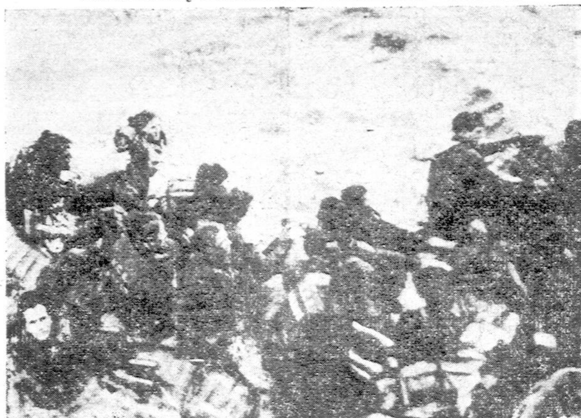
Išsigelbėję HMCS Clayoquot laivo jūreiviai lipa iš vandens į guminę valtėlę. Laivas, Kanados minų naikintojas, buvo sutorpeduotas ir aštuoni vyrai žuvo. Tai buvo 20-tas Kanados karo laivas žuvęs šio karo metu. Šie vyrai buvo išgelbėti Kanados laivo HMCS Fennel.