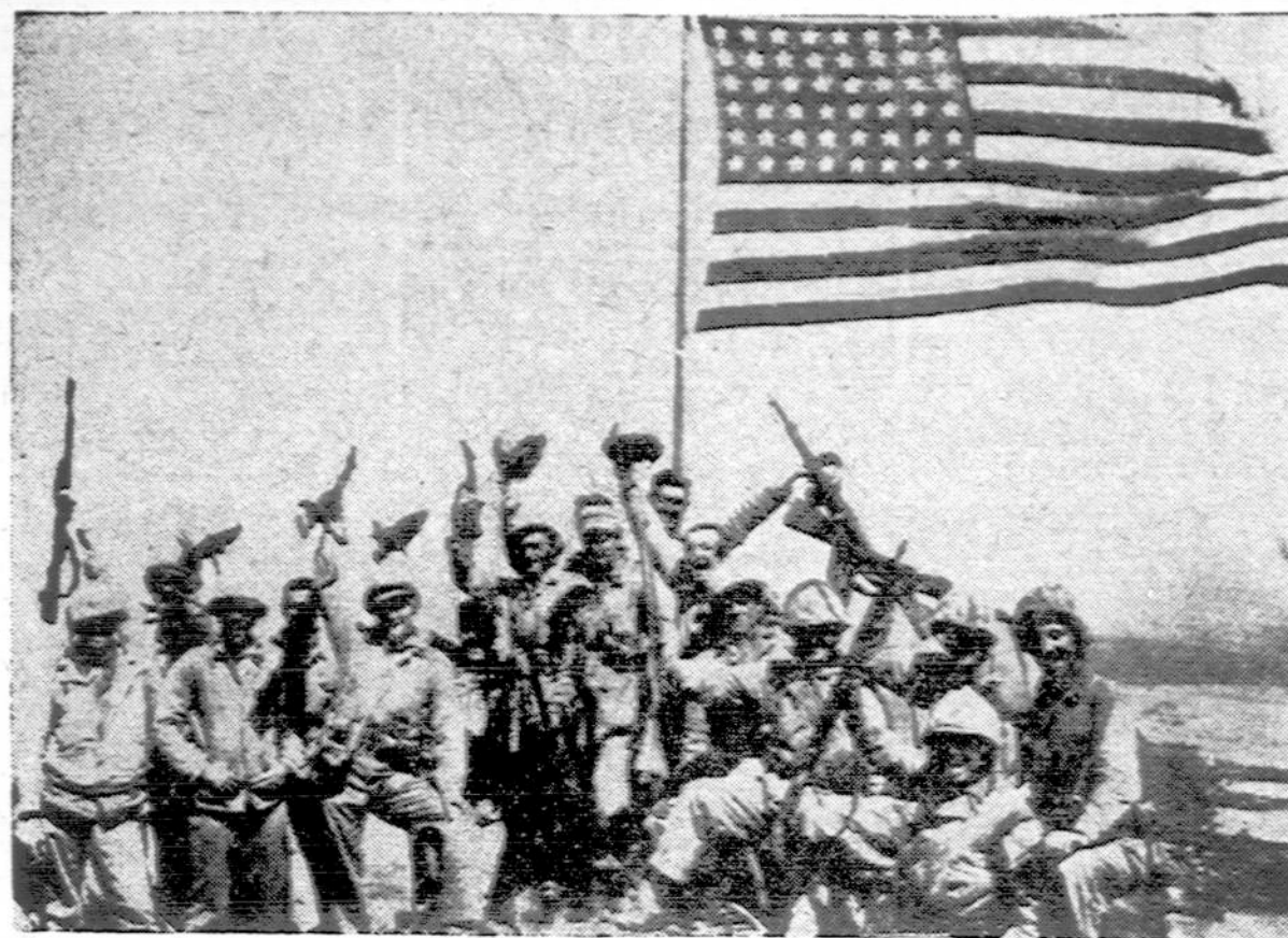
Užgrūdinti kovose marinai iškelia Amerikos vėliavą ant Suribachi kalno, Iwo Jima saloje, kurios pusę jau valdo amerikiečiai. Neužilgo mūs vėliava užplevėsuos ir ant visos salos.