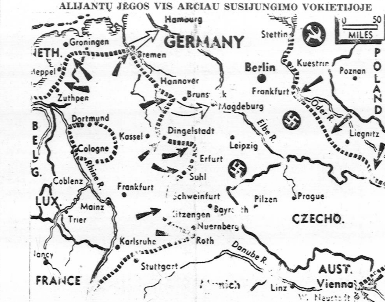
ALIJANTŲ JĖGOS VIS ARČIAU SUSIJUNGIMO VOKIETIJOJE Amerikos 9-tos armijos kariai jau pasiekė Magdeburgą ir Elbe upę, tik 63 mylias nuo Berlyno. Šiaurėje amerikiečiai ir britai pasistūmė iki Hamburgo ir Brunswicko. Ruhr klony alijantai išmuša sugautą nacių jėgą. Rytuose rusai baigia okupuoti Vieną, ir veržiasi Miuncheno ir Pragos link, iš kur galės susijungti su alijantų armijomis vakariniam fronte.

LONDONAS, bal. 11. — Oficialūs sluoksniai Londono gauru raportus, būk naciai stumia Hitlerį į šalį, ir jo vieton gal pastatysią Gestapo viršininką Heinrich Himmlerį. Anglijos užsienių ministerijai artimi šaltiniai sakė jie neturi jokių žinių apie tokius raportus, ir pareiškė, kad visos dalykas atrodo kaip gandas, pabrėždami, kad jeigu ir būtų tiesa, tas niek nepaveiktų karo eigos. Kitas gandas sakė Hitleris "miršta." Dar kitas sakė Hitleris buvęs nužudytas.