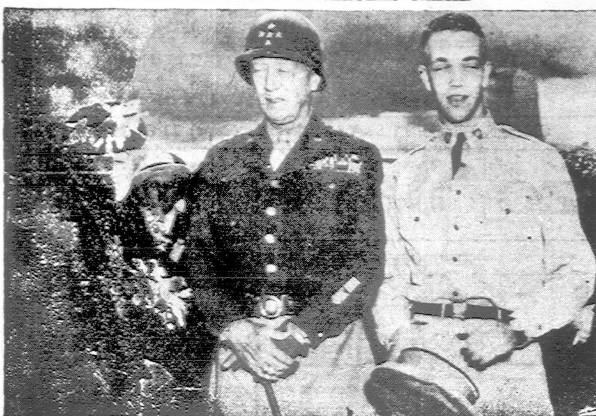
Generolas George S. Patton, komendantas Amerikos Trečiosios Armijos, tankų ekspertas, ir briliantinis kovų vadas, parvykęs namo. Bedford, Mass., aerodrome jį pasitinka žmona ir sūnus, kadetas West Point.

Bet, žinant, kad jo dvi žmonos jau mirė ir antru kartu namai sudega, aišku, ką jis turi mintyje). Liepos 26 d., kai visas miestas degė, tai ir mano namai bei kas buvo likę namuose sudegė, o rugpiučio 18 d. mūsų kaime visus daiktus išvogė, mes su žmona buvome mieste, o tėvai (cenzūros iškirpta), bet negalėjo... (cenzūros iškirpta), ant savęs, o rugpiučio