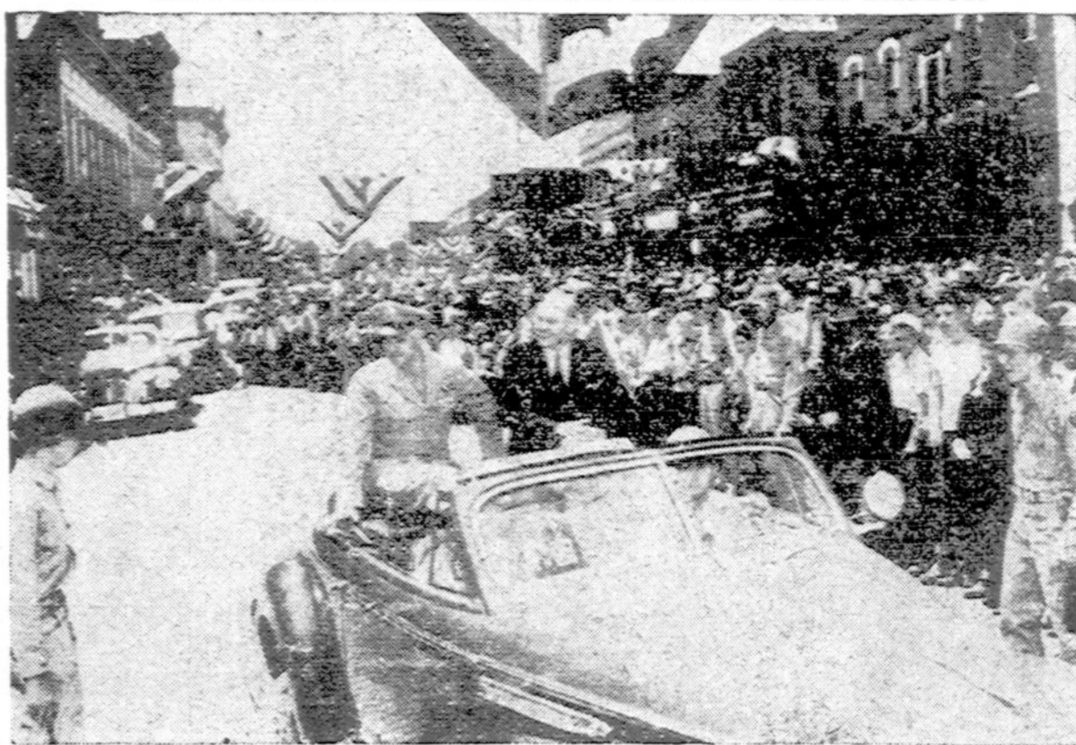
LOS ANGELES ISKILMINGAI PRIEMĖ GEN. PATTON

Gen. George S. Patton Jr. sveikina minią, kuri susirinko priimti jį Los Angeles, Cal., kur dviejų dienų celebracijose pagerbtas jis ir Gen. James Doolittle. Kalbėdamas į Episkopalo sekmadienio mokyklos vaikučius, Patin sakė "Jūs esate ateities kariai, jūreiviai ir slaugės. Bus kitas karas, kadangi visuomet buvo karų."