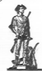
Pirkite Karo Bonų

Sios Paskolos Yra Daromos — Statybai, Remontavimui, Refinansavimui — ANT LENGVŲ MENESINIŲ ISMOKĖJIMŲ! Pasinaudokite Žemoms Nuosimčių Kainoms. TAPKITE FINANSINIAI NEPRIKLAUSOMI! TAPYKITE mūsų įstaigoje. Jūsų indėliai rūpestingai globjami ir ligi $5,000.00 apdrausti per Federal Savings and Loan Insurance Corporation. Jūsų pinigai bus greitai išmokami jums ant pareikalavimo. SENIAUSIA IR ŽYMAUSIA LIETUVIŲ FINANSINĖ ĮSTAIGA — 47 Metai Sekmingo Patarnavimo!