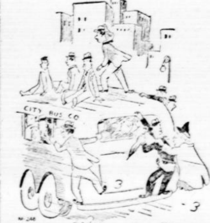
"HOW AREN'T YOU SORRY YOU DIDN'T TAKE BETTER CARE OF YOUR CAR?"

Jeį pirksi karo bonus — greičiau karas baigsis.