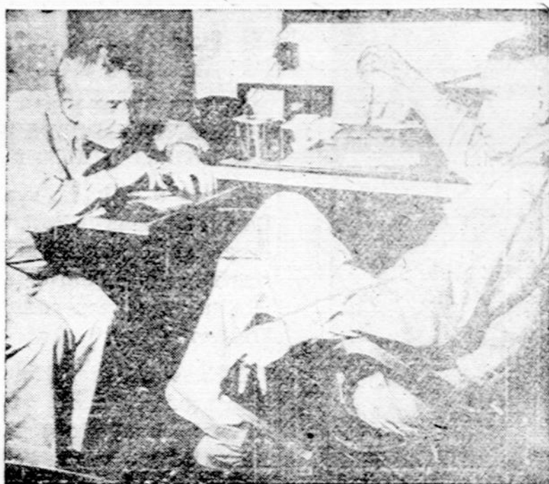
Admirolas William F. Halsey (dešinėje) ir Vice Admirolas John S. McCain kredituojami už sėkmingą Japonijos bombardavimą iš oro ir jūrų.