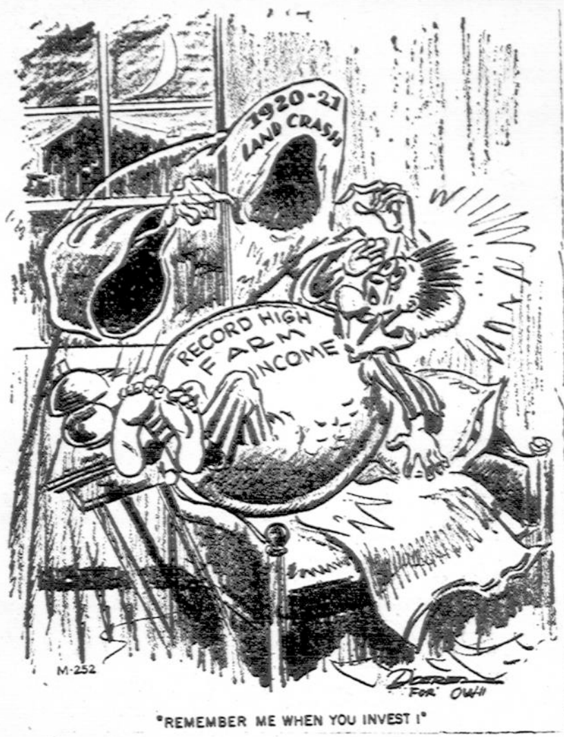
"REMEMBER ME WHEN YOU INVEST"

Dėkite pastangas, kad Lietuva atgautų nepriklausomybę.