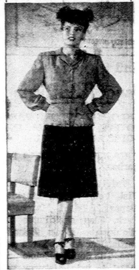
The trim smartness of this rosy-pink and black jacket dress, with its wide shoulders and full sleeves, can be duplicated by a home-sewer. Be well-dressed and patriotic, too, buying War Bonds with your savings by sewing. U. S. Treasury Department