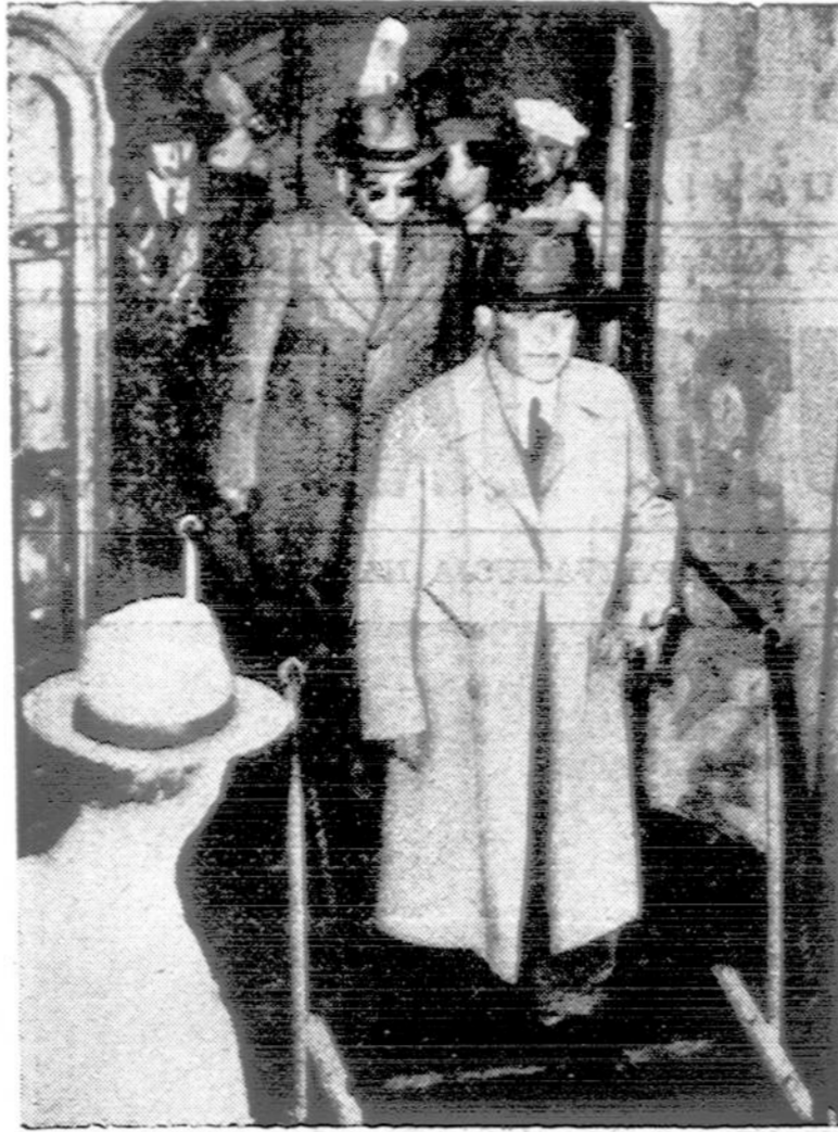
Horoshi Oshima, Japonijos ambasadorius Vokietijai, paimtas į nelaisvę su kitais diplomatais atgabentas į Ameriką.