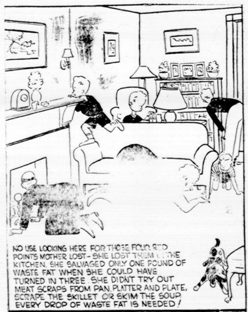
NO USE LOOKING HERE FOR THOSE FOUR RED POINTS MOTHER LOST - SHE LOST THEM IN THE KITCHEN. SHE SALVAGED ONLY ONE POUND OF WASTE FAT WHEN SHE COULD HAVE TURNED IN THREE. SHE DIDN'T TRY AND MEAT SCRAPS FROM PAN, PLATTER AND PLATE, SCRAPE THE SKILLET OR SKIM THE SOUP. EVERY DROP OF WASTE FAT IS NEEDED!

Ūmai beveik šalia jo atsirado vidutinio ūgio, apystandus, elegantiškas ponas, kokių penkiasdešimties metų amžiaus, į savo kėdės numerį pažvelgęs, jis pasiliko stovėti netoli Klemenso, taip pat dairydamsis po publiką. Daugėla pamatė, kad veik visi žmonės sveikino jį su ryškia pagarba, artimesnieji nuosirdžiai paspausdami jo ranką, toliau stovintieji žemai nusilenkdami. Ir visiems jis atskirai kaip aimanai ir didžio skausmo dejonė skambėjo vienas balsas: —