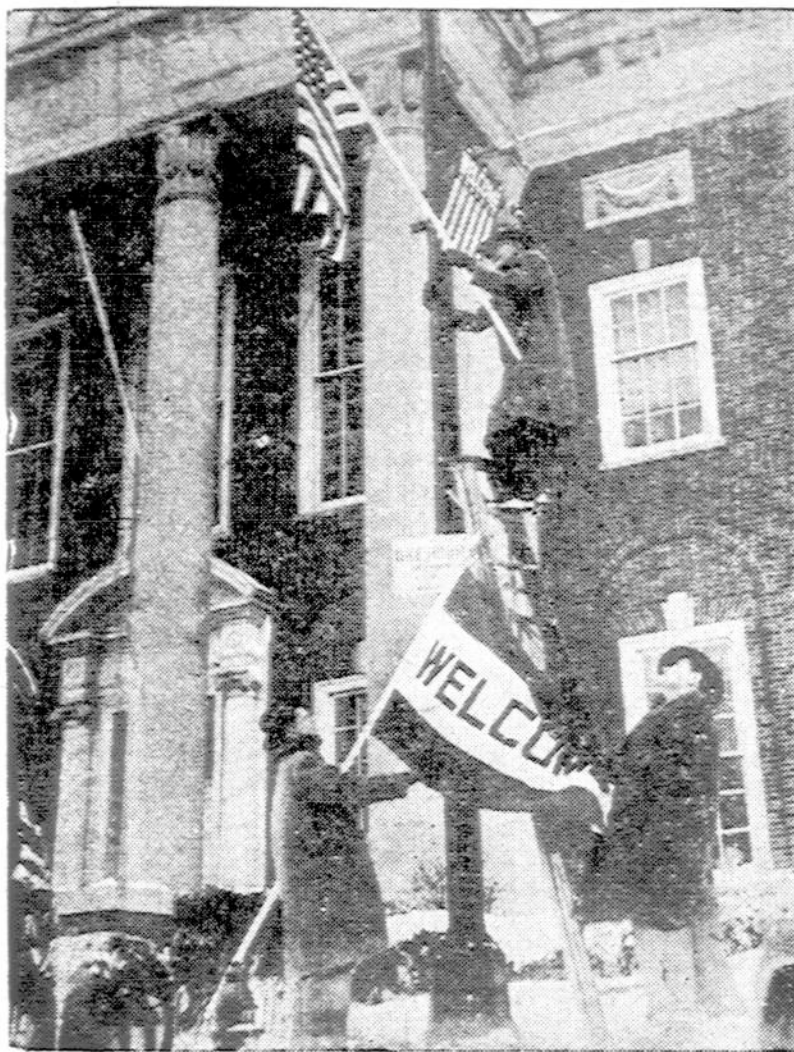
Trys vyrai puošia kalėdiniai Independence, Mo., miestelio teismo rūmus. Prezidentas Truman pareiškė, kad Kalėdų švesti jis parvyks į savo gimtinę.