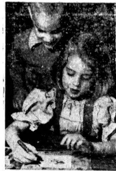
CRAYONS MAKE gay decoration for gift boxes of toys and school supplies sent children abroad by Junior Red Cross members in this country. Last year 500,000 boxes were packed for shipment.

Prasyskite jos vietinį valstineį, o jeigu jūų valstiniukas neurti, atsiųskite savo užsakymus su pinigais tiesiog į — Bath Products Co. Laboratories — Chicago, Ill.