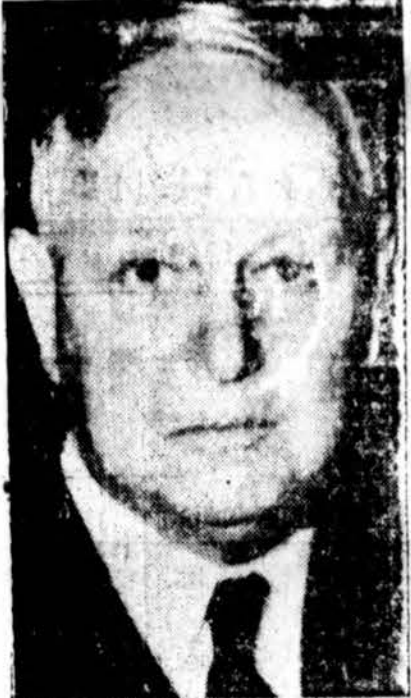
Admirolas Husband E. Kimmel, buvęs komanderis Pearl Harbor prieš japonams užpuolant, šiomis dienomis liūdydys kongresiniam komitetui Pearl Harbor byloje.