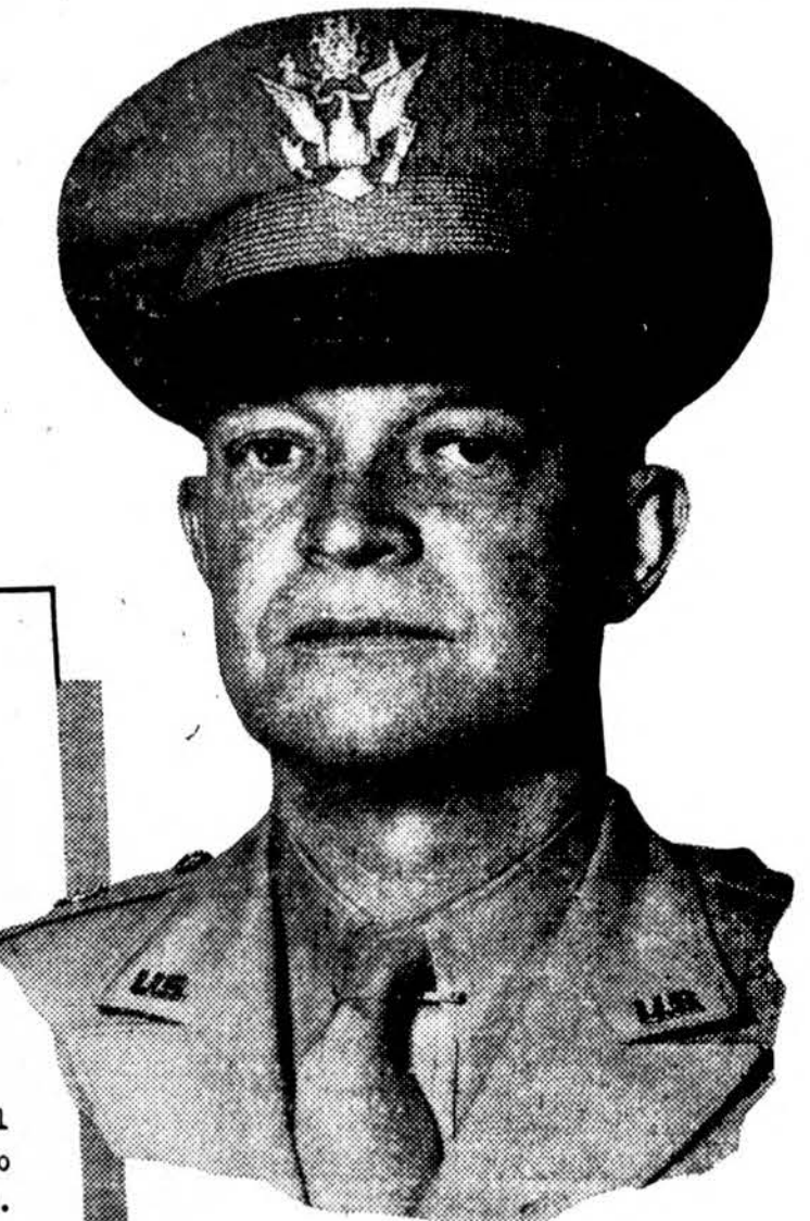
Žymieji Dalvkai NAUJOJO ISTOJIMO AKTO

WAR DEPARTMENT OFFICE OF THE CHIEF OF STAFF The purpose of the Army's world-wide enlistment campaign is twofold: to release men of long and arduous war service who want to return to civilian life--and to build a strong Regular Army of volunteers. By our victory we have won the respect of the world. We can lose that respect, and with it our influence toward a just and peaceful world order, if we reduce our military forces to the point where they become weak or ineffective. The Congress has enacted and the President has approved legislation which makes enlistment in the Regular Army more attractive than ever before in our history. It gives the soldier a position in the new peacetime Army that merits the respect of all our citizens. Every American should know the valuable provisions in this new Armed Forces Voluntary Recruitment Act. They help place your Regular Army on the highest plane of any army on earth--with advanced study, training and travel at good pay in a career of high duty and responsibility. There is a solid obligation on all of us to safeguard the victory we have won at such enormous cost. The rapid rebuilding of our Regular Army is a vital necessity if we are to meet that obligation. Dwight D. Eisenhower Chief of Staff, United States Army