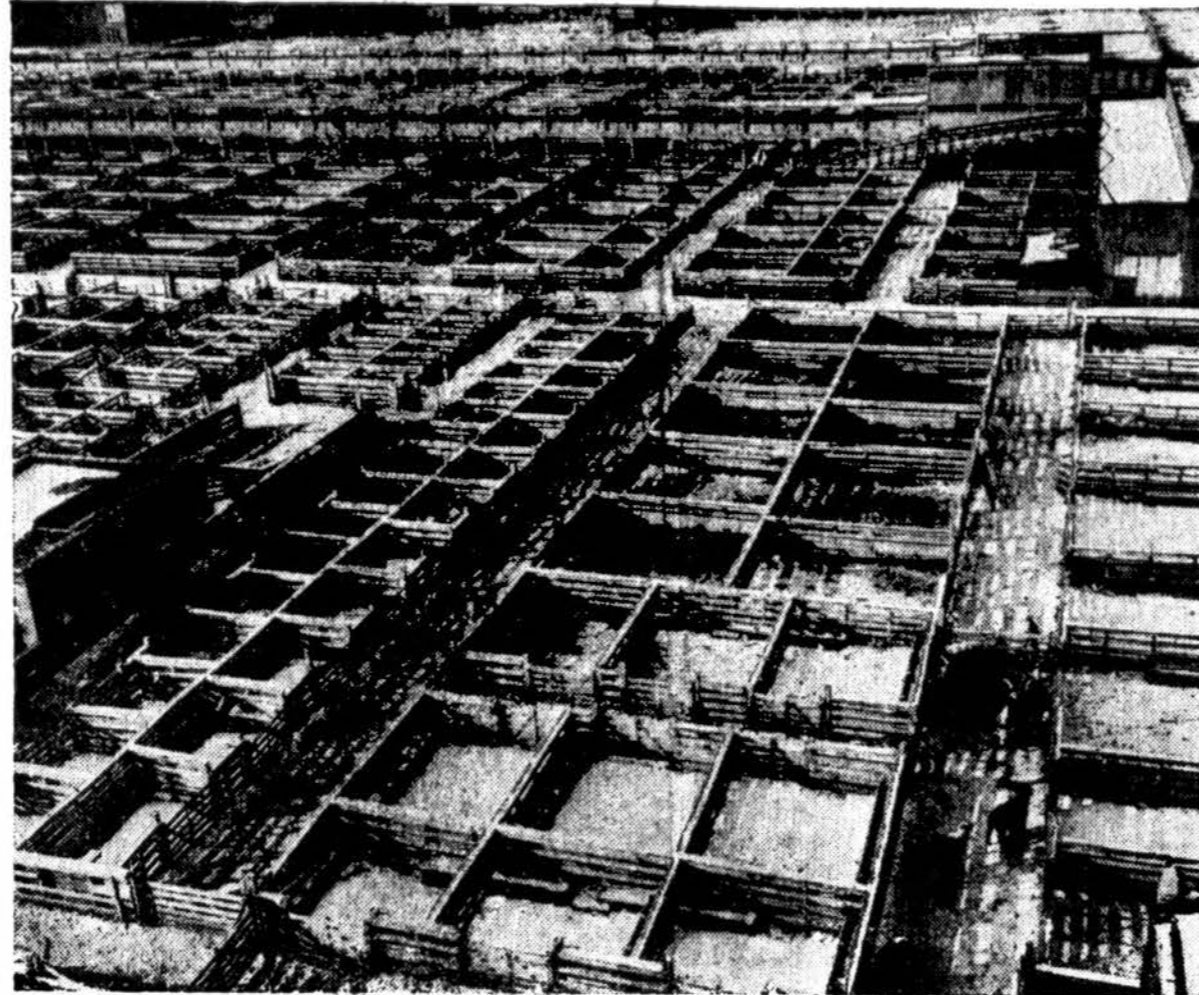
CHICAGOS SKERDYKLOSE NERELIKO GALVIU

Tvartai, kuriuose laikomi jaučiai Chicagos skerdyklose, tušti vykstant 35,000 Chicagos skerdyklų darbininkų streikui. Visame krašte streikuoja kitas 300,000 mėsos darbininkų.