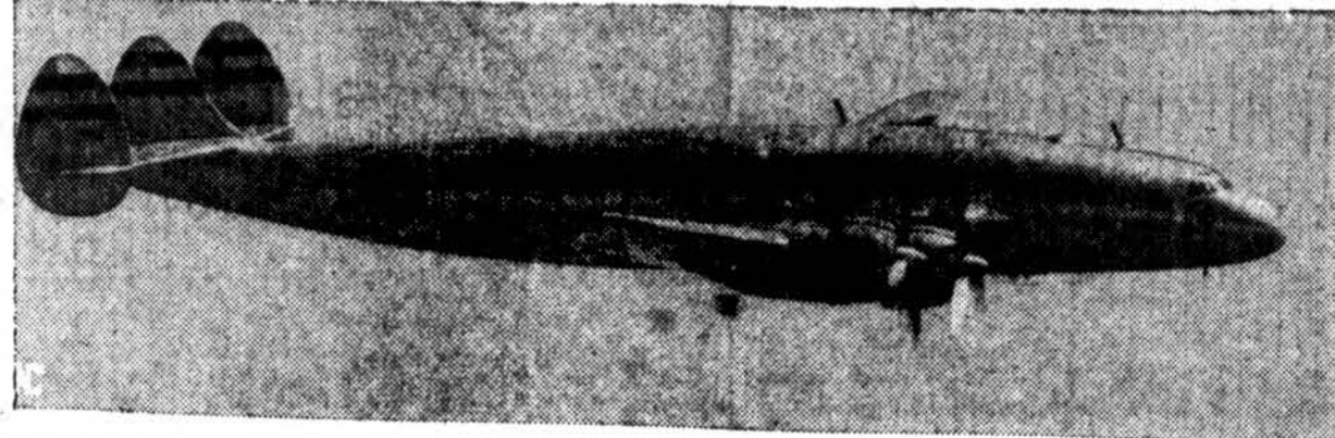
“CONSTELLATION” LEKTUVAI NUVEŠ KARDINOLUS ROMON

—Atsilygindama už Irano klausimo iškėlimą, Rusijos UNO delegacija vakar prašė apsaugos tarybą ištirti politinę suirutę Graikijoje ir Javoje, kur vis dar tebestovi Anglijos karių daliniai.