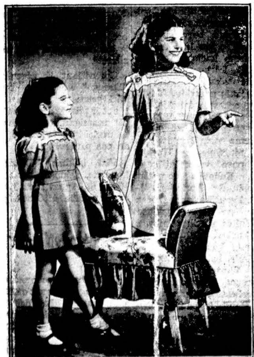
BOTH these sisters are wearing matching dresses of colorful, serviceable spun rayon. They have contrasting yokes edged with scalloped set-in belts that tie in back, and circular skirts. Youngsters' clothes—whether they're for school or dress-up—should be built to "take it." Your best assurance that children's rayon garments have the necessary service qualities is to look for informative labels that tell you about the laboratory tests the fabric has passed for durability, color-fastness, shrinkage, etc.