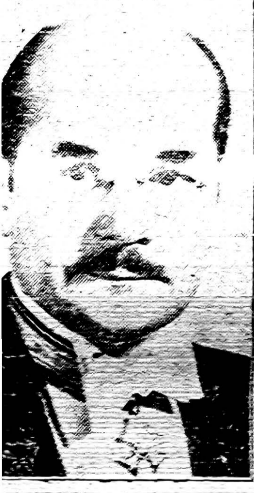
Mayoras Edward J. Kelly.

umpas, bet svarbias ir šmingas kalbas pasakys ymūs kalbėtojai: Chicago miesto galva-