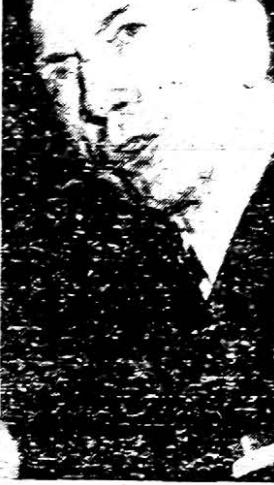
Harold L. Ickes, rezigna- ves iš Vidaus Departamento Sekretoriaus pareigų.

rikos Lietuvių Tarybos Ke- noshos kuopa.