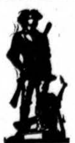
Pirk Victory Bonus!

Šios Paskolos Yra Daromos — Statybai, Remontavimui, Refinansavimui — ANT LENGVŲ MEREŠINIŲ IŠMOKĖJIMŲ! Pasinaudokite žemoms Nuomėjų kainoms.