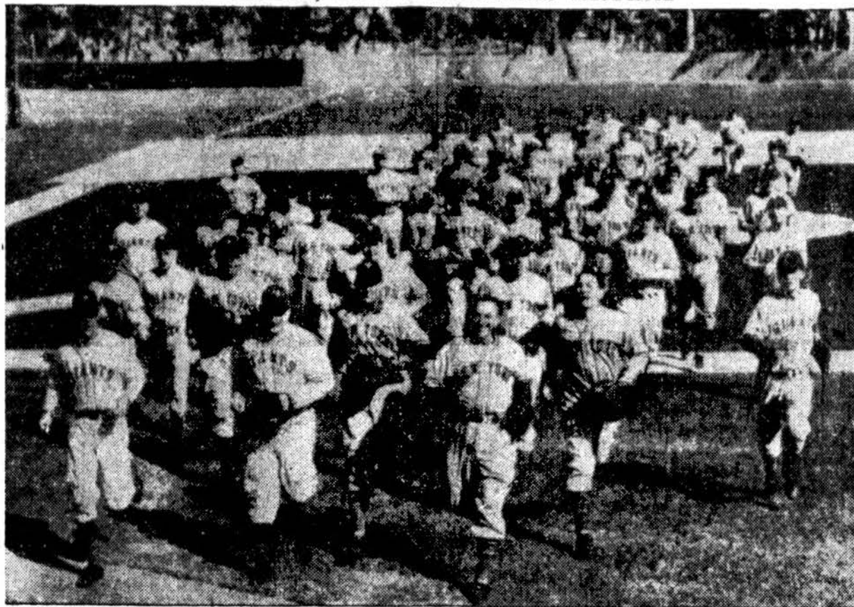
New Yorko Giants baseball komanda išeina į baseball lauką pirmai pratybai saulėtaj Miami, Florida. Viscs baseballo komandos jau pradėjo pratybas šiltuoje kraštoje ir žaidimo mėgėjai skaito tai tikru ženklu, kad pavasaris negali būti per toli.