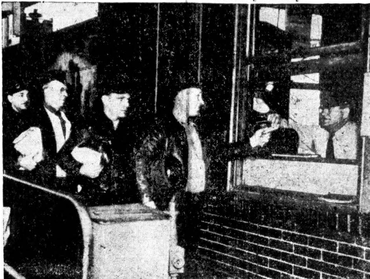
PLIENO DARBININKAI SUGRIZTA I DARBĄ

Darbininkai Carnegie Illinois plieno liejykloje Pittsburghe sugrįžta į darbą pirmą kartą nuo sausio 21, po to kai unija ir didžiosios plieno bendrovės susitarė dėl algų pakėlimo ir tuo baigė streiką. Apie 20,000 plieno darbininkų tebestreikuoja, kadangi jų liejyklos, negaudamos plieno kainų pakėlimo, atsisako pasirašyti algų pakėlimo sutartis.