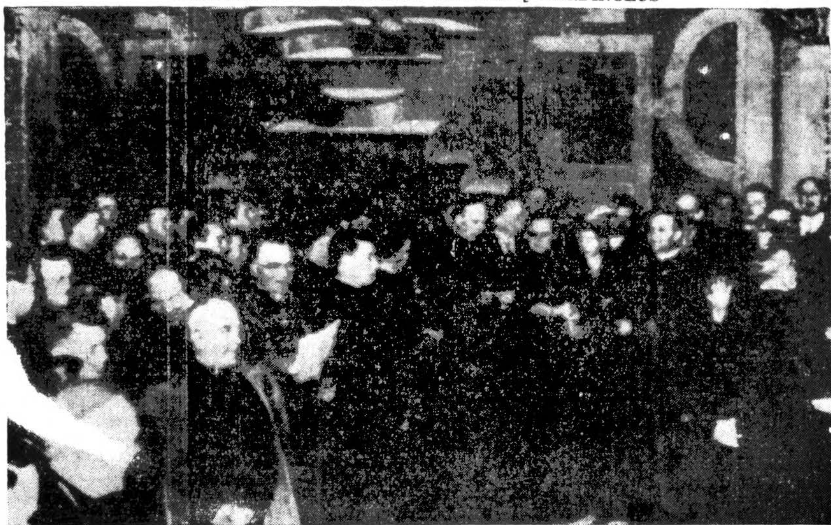
Tarpe keturių U.S. Arkivyskupų gavusių Popiežiaus laiškus pranešant jiems apie išrinkimą į Kardinolų Kongregaciją yra Edward Kardinolas Mooney iš Detroito (kairėje), laikas laišką ir žiūrįs į fotografiją, ir John Kardinolas Glennon iš St. Louis (viduryje, aukšta figūra, laikas voką). Apie juos yra būrys sveikintojų.