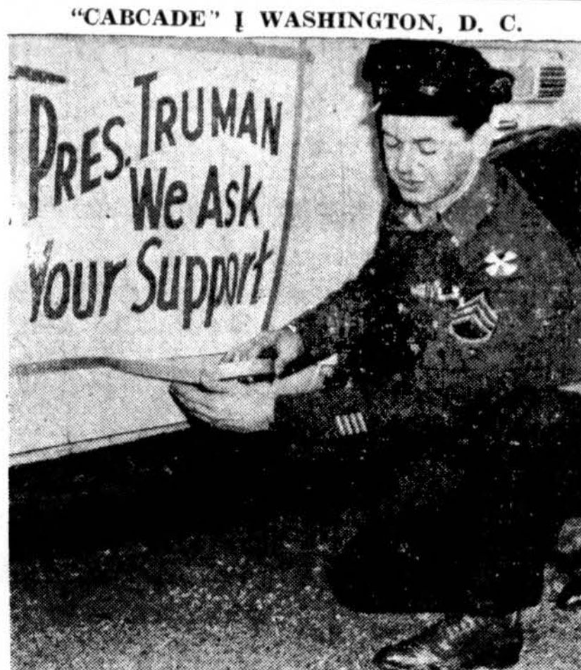
"CABCADE" I WASHINGTON, D. C. Vienas karo veteranų ruošia iškabą savo taksi, kuriuo jis, sykiu su arti dviem šimtais kitų veteranų, išvyko į Washington, kad federalė valdžia padarytų žygių gavimui leidimo jiems patarnauti Chicago gyventojams.

Jaunieji išėjo į miškus. Visi jie yra mirtini okupanto priešai ir Nepriklausomos Lietuvos viltis. Jų pavardes rusiškuose laureatų sąrašuose mes nematysime.