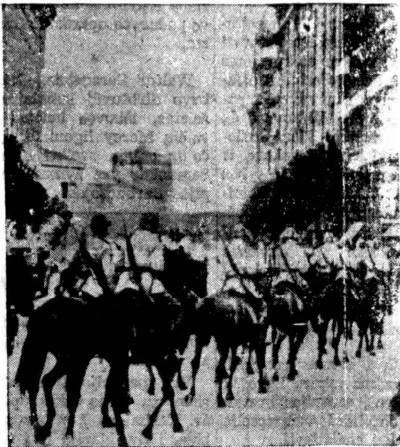
Prezidento rinkimo metu Buenos Aires, Argentinoj, gatvės patruliavo raitoji policija žiūrėdama, kad nevyktų riaušės, muštynės tarpe vienos ir kitos partijų šalininkų.