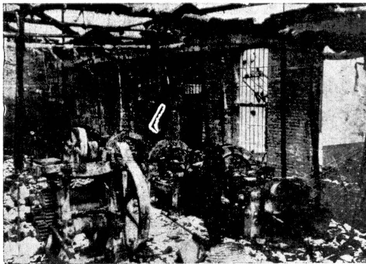
Vidus didelio gumos fabriko Mukden mieste, Mandžurijoje, po to kai rusai išvežė visą mašiniją. Pats pastatas buvo sužalotas gaisro.