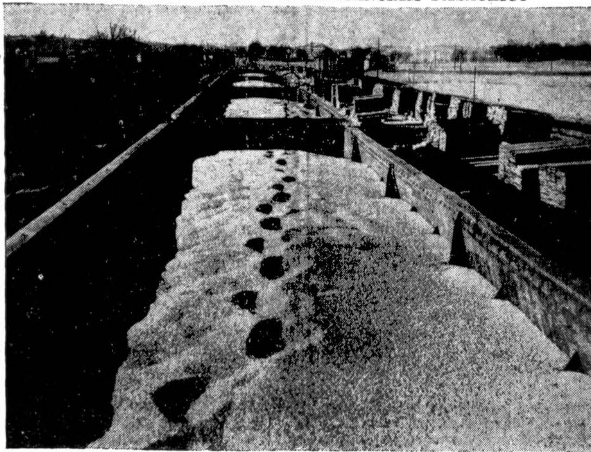
AMERIKA PAGELBĖS BADAUJANCIAM PASAULIUI

Neguskaikomi tūkstančiai pūdų kviečių atvežami atdaruose vagonuose pakrovimui Omaha, Neb. sandėliuose. Numatoma juos pasiūti maitinimui badaujančių žmonių karo nuteriotose šalyse. Prez. Trumanas prašė amerikiečius sumažinti kviečių vartojimą 40 nuošimčių, kad būtų galima toliau siūsti kviečius užjūrin.