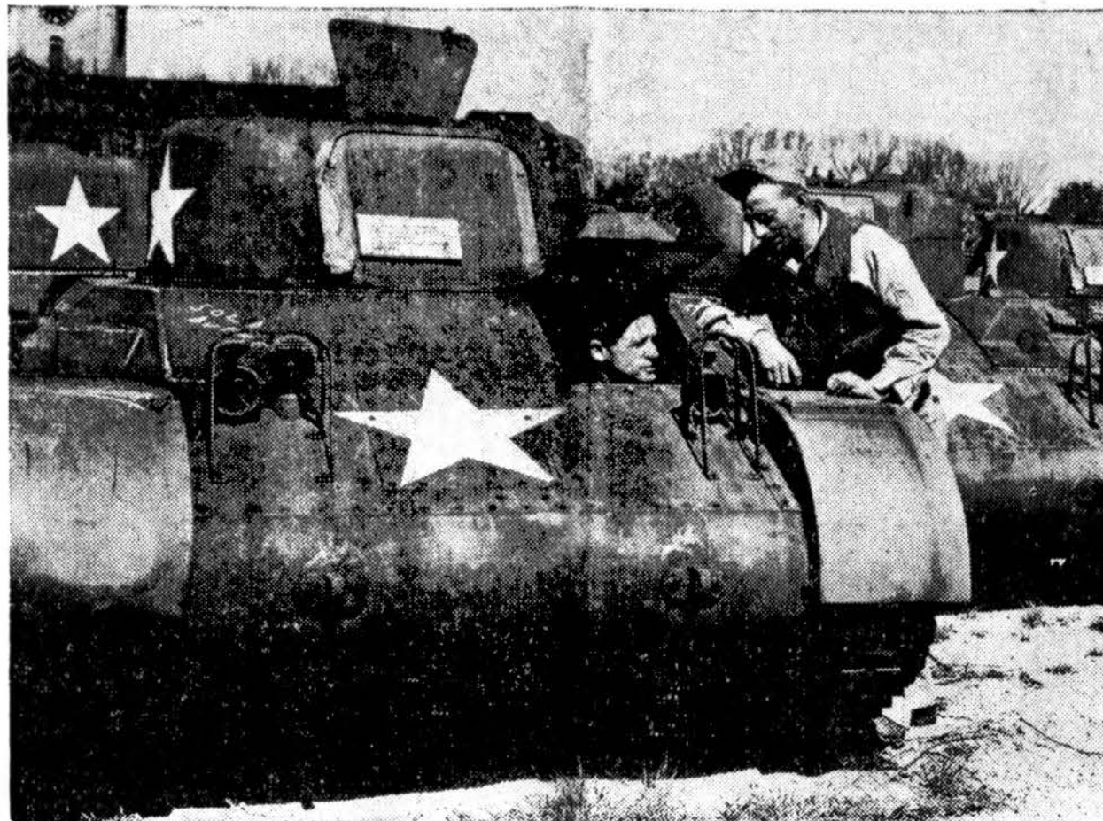
$25,000 TANKAI PARDUODAMI UŽ $100

Rock Island, Ill., kariuomenės arsenale dabar parduodami karo tankai, kuriuos daugiausiai perka fermeriai medžių kelmams rauti. Kiekvienas tos rūšies tankas vyriausybei atsėjo po $26,000, o parduodami po $100. Nuotraukoj vienas fermerys mokiamas tanką vairuoti.