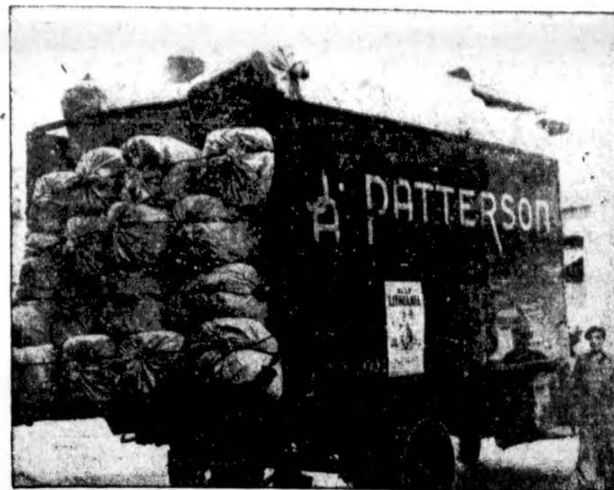
Amerikos lietuvių dovanoti drabužiai BALF sandėlio sunkvežimiu vežami į uostą, iš kur jie siunčiami Lietu- vos karo pagėbėjams ir tremtiniais Europoje.