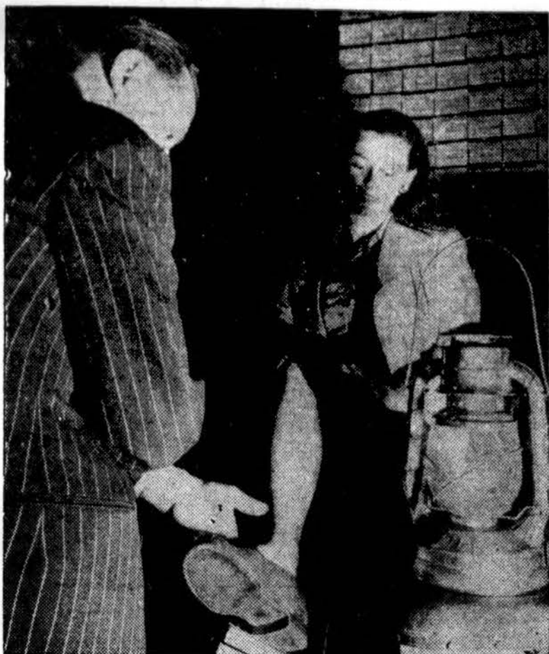
Chicago krautuvėse dabar biznis eina prie lempų ir žvakių šviesos. Nuotraukoj vienoj apavų krautuvėj prie lempos šviesos moteris renka si čeverykus.