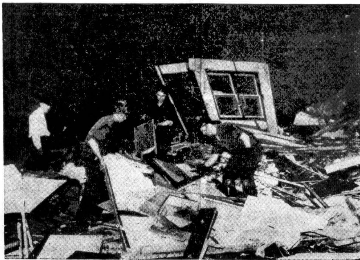
Cia parodoma River Rouge, Mich. padaryti nuostoliai, kuomet viesulas praužė per Detroit-Windsor, Kanados apylinkę, užmušdamas bent 17 asmenų, sužeisdamas bent 200 asmenų, ir pridarydamas šimtų tūkstančių dolerių vertės nuostolių.